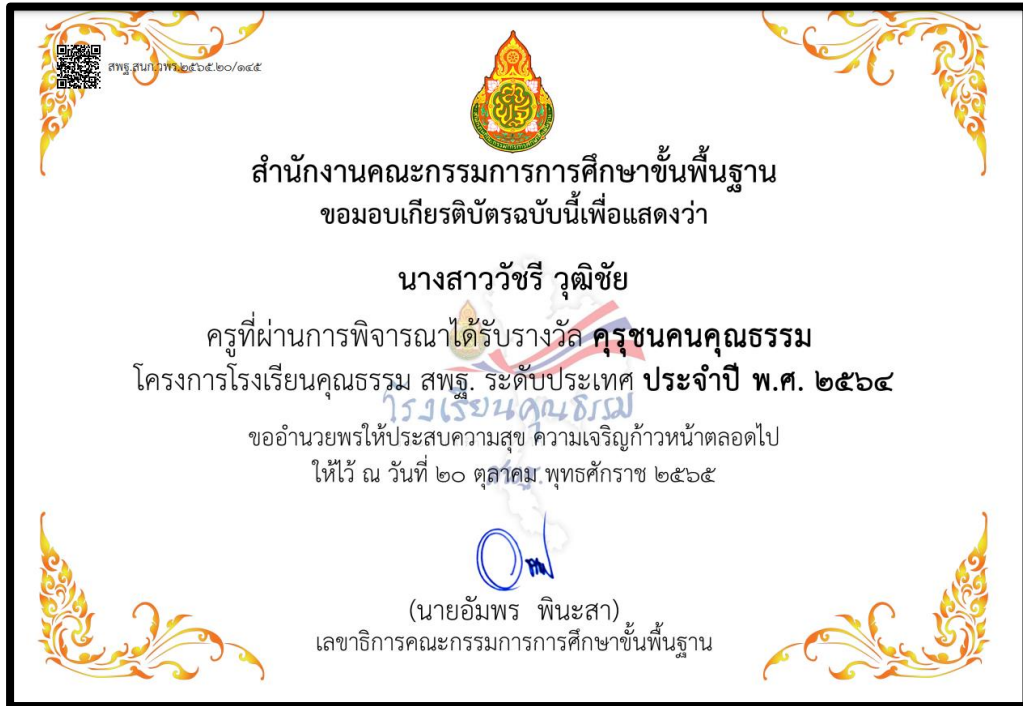
รางวัลยกย่องเชิดชูเกียรติ ครูชน คนคุณธรรม ประเภท ครู ระดับประเทศ