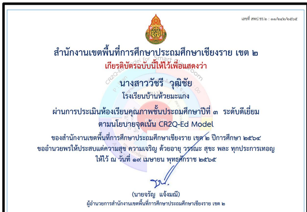
รางวัลห้องเรียนคุณภาพ ตามนโยบายจุดเน้นของ สพป.ชร. 2