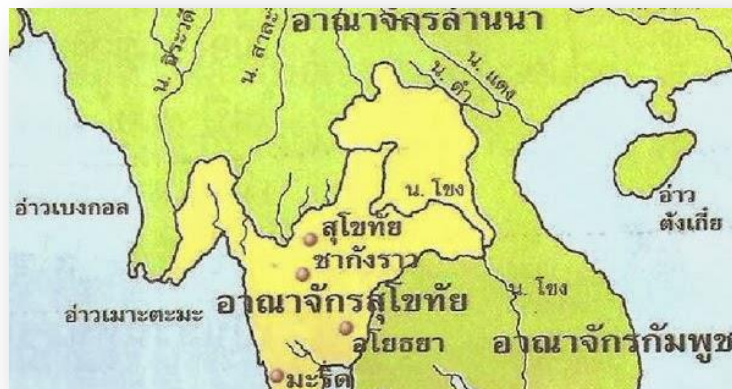
แผนที่กรุงสุโขทัย