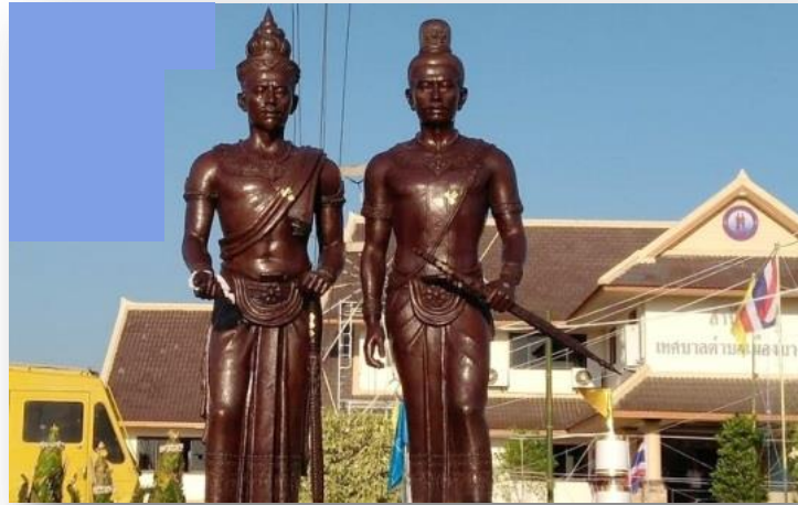
ภาพพระบรมราชานุสาวรีย์พ่อขุนผาเมือง(ซ้าย) และพระบรมราชานุสาวรีย์พ่อขุนศรีอินทราทิตย์ (ขวา ถือดาบ) ตำบลเมืองบางขลัง อำเภอสวรรคโลก จังหวัดสุโขทัย