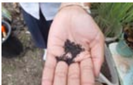
เมล็ดพันธุ์โหระพา