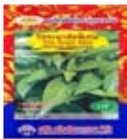
เมสตีพันธุ์โหระพา