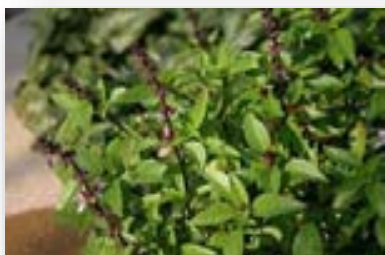
ใบโหระพา

โหระพาเป็นผักที่ใช้บริโภคเป็นผักสดหรือใช้ประกอบอาหารอื่นๆ ทำให้อาหารมีรสชาติและกลิ่นหอมน่ารับประทานนอกจากนี้ยังมีคุณค่าทางยาช่วยขับลมในลำไส้ แก้ท้องอืด ท้องเฟ้อ