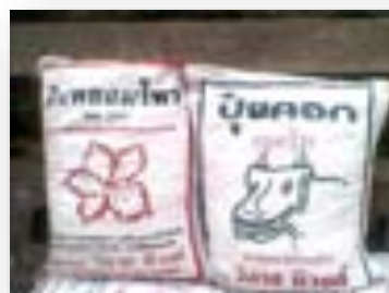
ปุ๋ยคอก ปุ๋ยหมัก