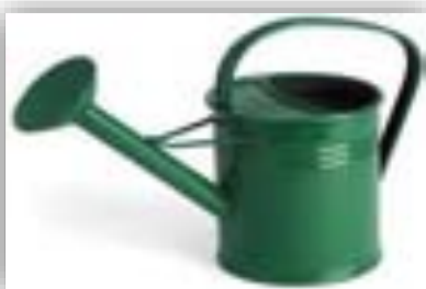
บัวรดน้ำ