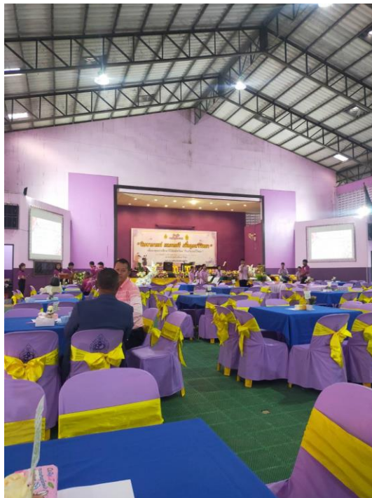
ข้าพเจ้าเข้าร่วมกิจกรรม “จิบกาแฟ แลคนตรี เพื่อลูกสวีวิทยา” ณ โรงเรียนสวีวิทยา อ.สวี จ.ชุมพร