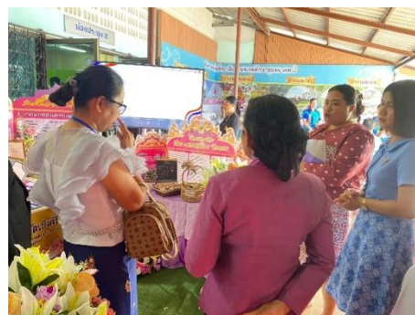
เข้าร่วมการประเมินโครงการสถานศึกษาสีขาว ปลอดภัยดีและอบายมุข ปีการศึกษา ๒๕๖๗ ณ สพป.ชพ.๒