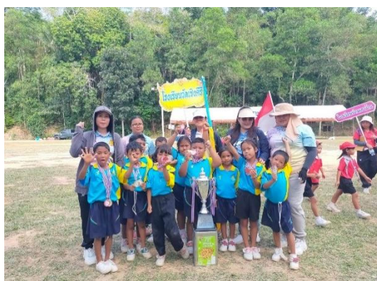
เข้าร่วมกิจกรรมกีฬา ฟันน้ำนมเกมส์ ครั้งที่ ๑