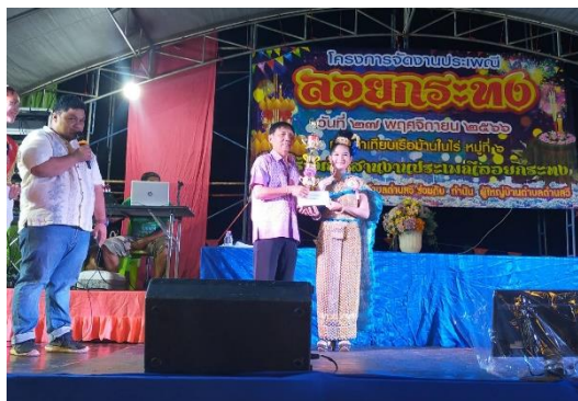
ข้าพเจ้าร่วมกิจกรรมลอยกระทง ทำเทียนเรือบ้านโนไร่ อ.สวี จ.ชุมพร