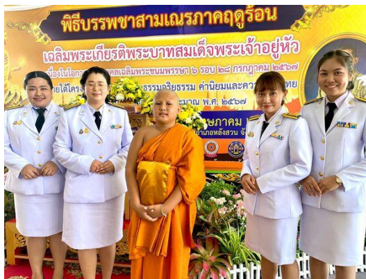
เข้าร่วมพิธีบรรพชาสามเณรภาคฤดูร้อน ณ วัดราชบูรณะ (พระอารามหลวง) ปี ๒๕๖๗