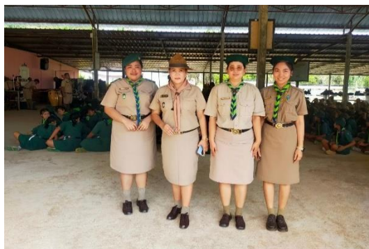
ข้าพเจ้าเข้าร่วมกิจกรรมเข้าค่ายลูกเสือ ค่ายลูกเสือกาญจนา ประจำปีการศึกษา ๒๕๖๖