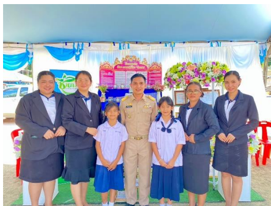
ข้าพเจ้าได้ร่วมจัดนิทรรศการ Open House โรงเรียนบ้านเขาค่าย