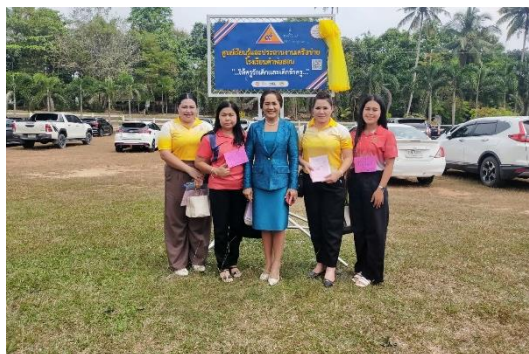
ข้าพเจ้าเข้าร่วมสัมมนาการประชุมปฏิบัติการเปิดบ้าน โรงเรียนคำสอนพ่อ รร.บ้านคลองกก