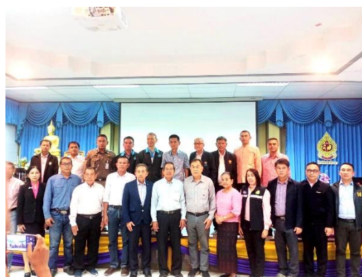
เข้าร่วมประชุมปฐมนิเทศโครงการ โครงการศึกษาแผนหลักและความเหมาะสมการบรรเทาอุทกภัย อำเภอสวี จังหวัดชุมพร