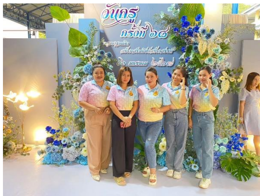
ร่วมกิจกรรมงานวันครู ปี ๒๕๖๗