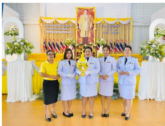
ข้าพเจ้าร่วมกิจกรรมเนื่องในวันคล้ายวันพระราชสมภพ ร.๙ อำเภอสวี จังหวัดชุมพร