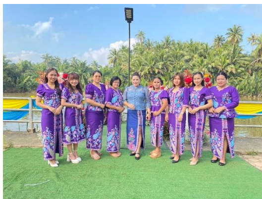
ข้าพเจ้าร่วมกิจกรรมแข่งเรือขึ้นโขนชิงธง ณ วัดดอนสะท้อน จ.ชุมพร