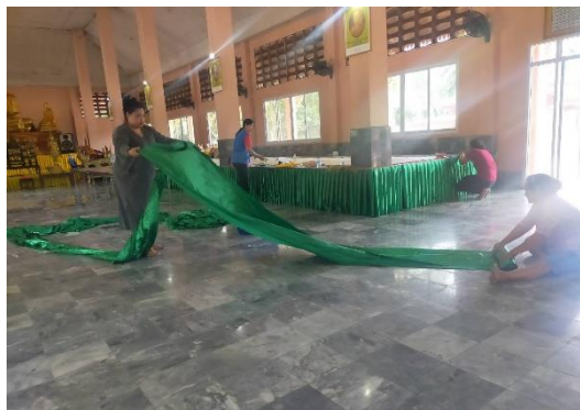
ข้าพเจ้าจัดสถานที่งานทอดกฐิน วัดเวฬุวัน จ.ระนอง