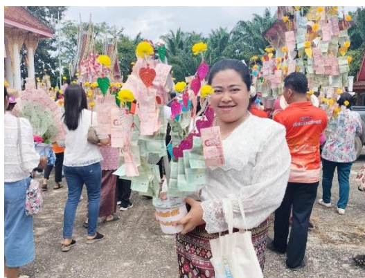
ข้าพเจ้าเข้าร่วมกิจกรรม ทอดกฐินวัดเชิงคีรี