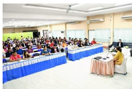
ข้าพเจ้าเข้าร่วมประชุมเชิงปฏิบัติการจัดทำประมาณการราคาค่าวัสดุและการกำหนดราคากลาง (ปร.๔,๕,๖)