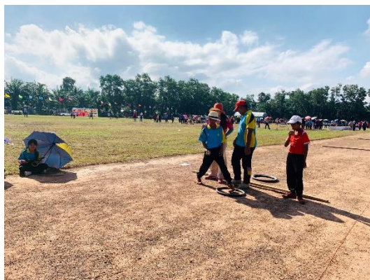
ข้าพเจ้าร่วมกิจกรรมการแข่งขันกีฬา ครนเกมส์ ครั้งที่ ๑๗ อบต.ครน