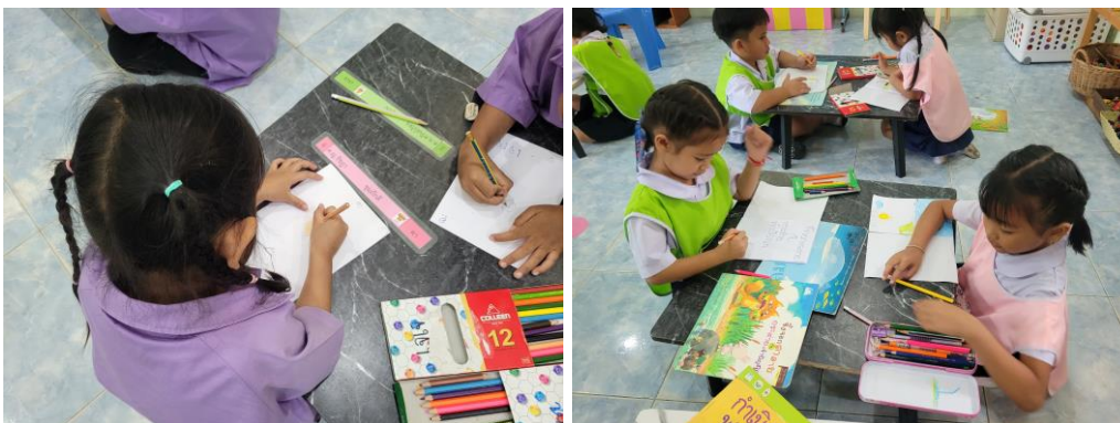
3) จัดสภาพแวดล้อมในห้องเรียน มุมหนังสือนิทาน มุมขีดเขียน