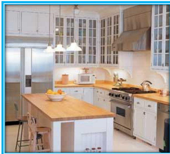
ภาพที่ 7 ห้องครัว