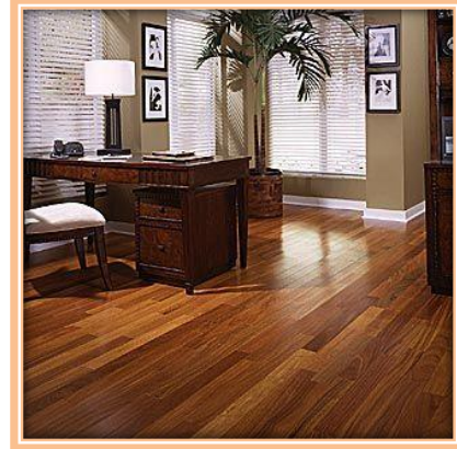
ภาพที่ 3 พื้นปูด้วยไม้

ให้กวาดด้วยไม้กวาดดอกหญ้า แล้วถูด้วย ผ้าชุบน้ำบิดหมาดๆ