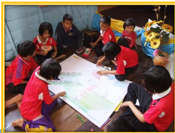
ภาพที่ 1 การทำงานกลุ่ม

ที่มา : https://www.l3nr.org . 14/03/2559