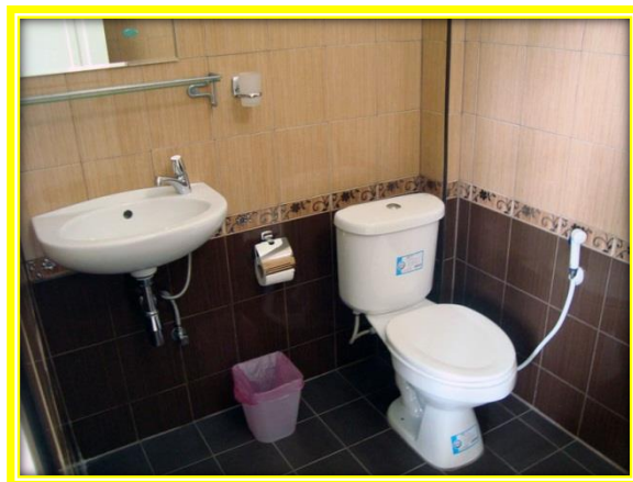
ภาพที่ 6 ห้องน้ำ

ที่มา : http://www.seabeachthailand.com . 14/03/2559