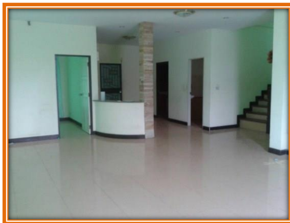
ภาพที่ 4 พื้นปูด้วยกระเบื้อง

พื้นหินขัด พื้นซีเมนต์ และพื้นปูกระเบื้อง ถ้าพื้นไม่สกปรกมากจะใช้วิธี ทำความสะอาดเหมือนพื้นไม้ แต่ถ้าพื้นสกปรกมากควรใช้น้ำผสมผงซักฟอกกรด และใช้แปรงขัดให้สะอาด ราดน้ำเปล่าตาม ให้หมดคราบน้ำ ผสมผงซักฟอก จนพื้นสะอาด แล้วใช้ผ้าถูให้แห้ง