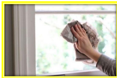
ภาพที่ 2 กระดาษหนังสือพิมพ์เช็ดกระจก