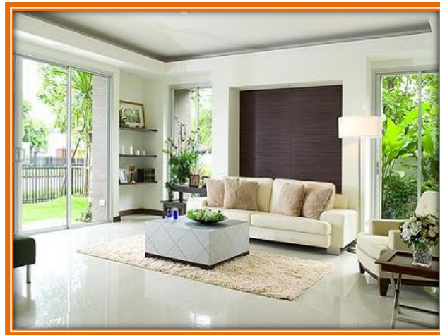
ภาพที่ 8 ห้องรับแขก

ที่มา : https://www.google.co.th . 14/03/2559