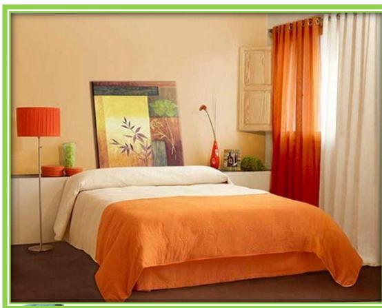
ภาพที่ 5 ห้องนอน