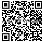
QR code แผนการจัดการเรียนรู้วิชาการป้องกันการทุจริตป.2

- มีการใช้สื่อการสอนที่ครูผลิตขึ้นเอง บูรณาการครบทั้ง 4 หน่วยการเรียนรู้