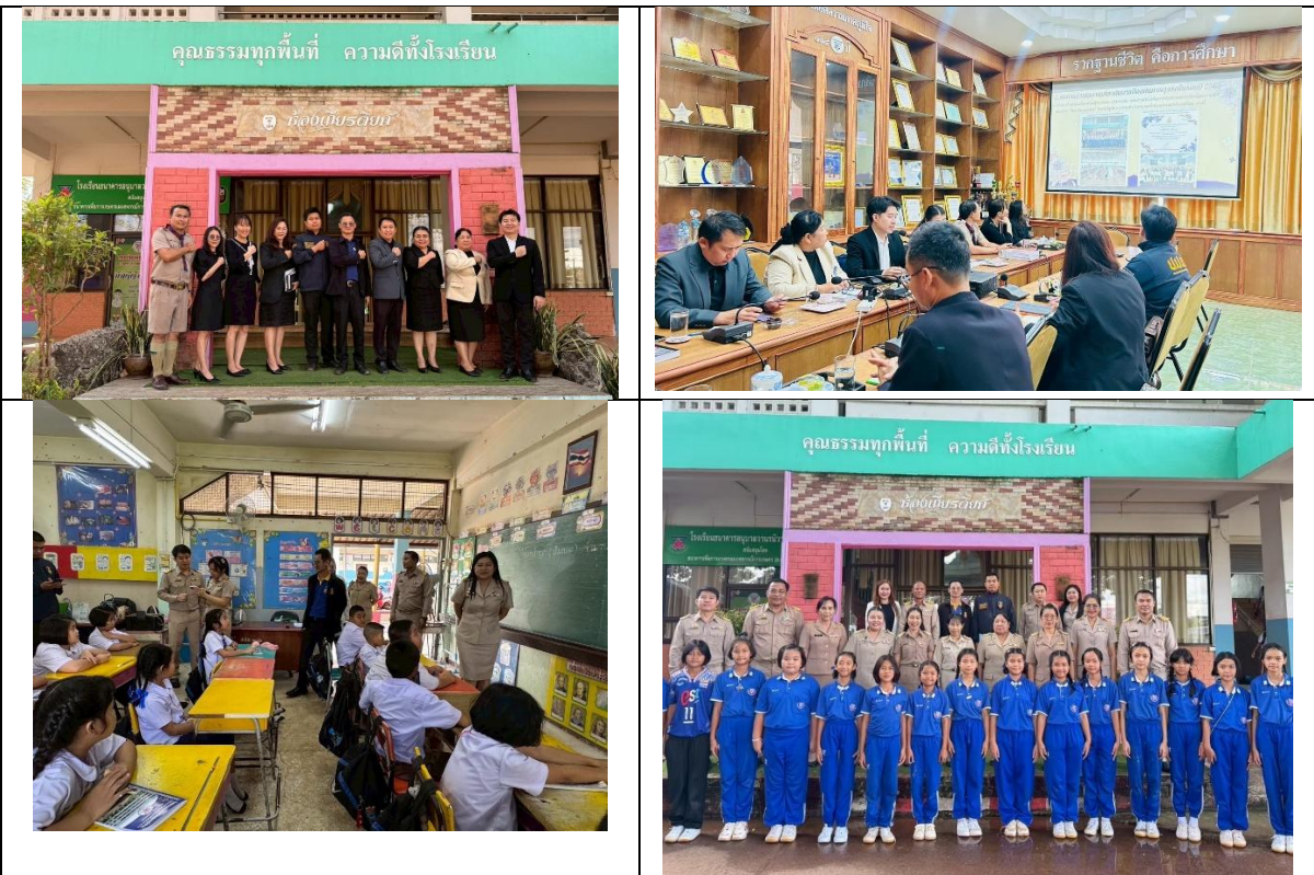
รับการนิเทศติดตามโครงการโรงเรียนสุจริต จากสำนักงาน ป.ป.ช. จังหวัดสกลนคร