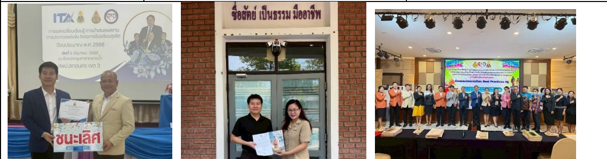
สร้างเครือข่ายในระดับเขตพื้นที่ สร้างเครือข่ายในระดับ ป.ป.ช จังหวัดสกลนคร สร้างเครือข่ายในระดับภาค