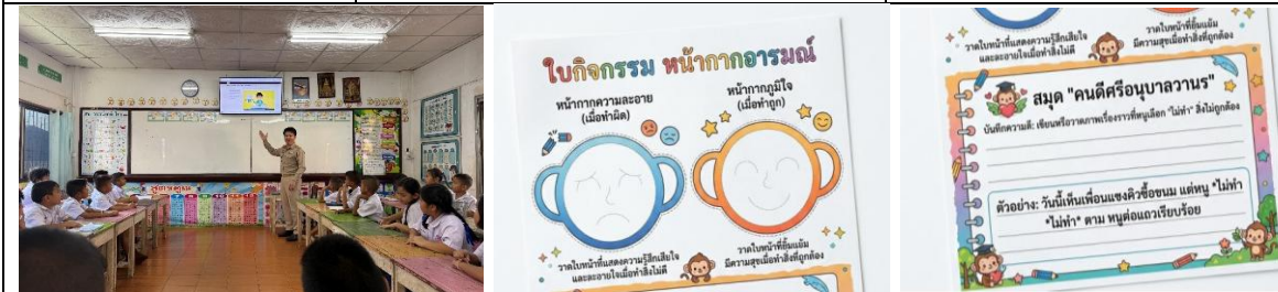
“ซื่อสัตย์สุจริต นักเรียนเข้าใจการต่อต้านการทุจริตการไม่ลอกการผู้อื่น ไม่นำทรัพย์สินของผู้อื่นมาเป็นของตนเอง”