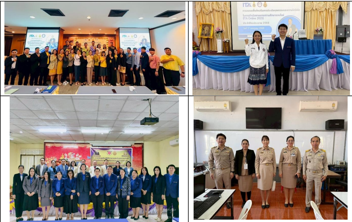
การนิเทศติดตามประเมินผลโครงการโรงเรียนสุจริต จากผู้บริหารสำนักงานเขตพื้นที่ศึกษา และคณะศึกษานิเทศก์ ในการจัดกระบวนการเรียนรู้