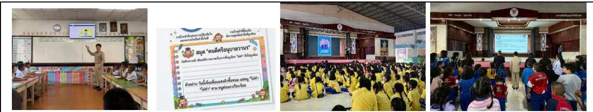
“เรียนรู้ผ่านสื่อแพลตฟอร์มออนไลน์ของ ป.ป.ช. กิจกรรมสมุดบันทึกความดีศรีอนุบาลวนาร ปลุกฝังค่านิยมความสุจริตอย่างต่อเนื่อง”