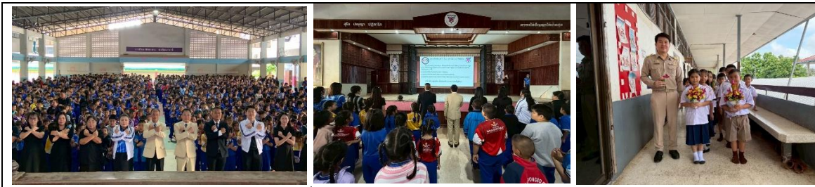
“มีวินัย นักเรียนตรงต่อเวลา มีการแต่งกายที่สุภาพเรียบร้อย การเข้าแถวอย่างเป็นระเบียบ”