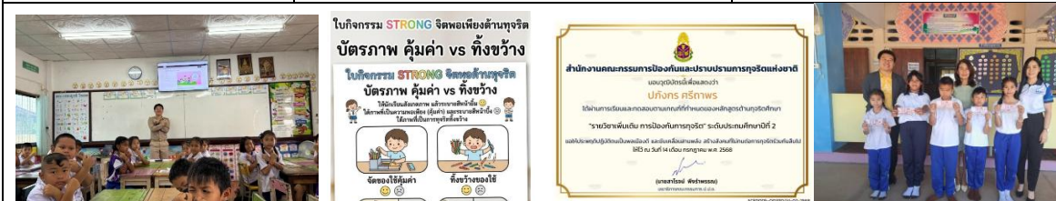
“อยู่อย่างพอเพียง การฝึกใช้เทคโนโลยีและทรัพยากรการเรียนรู้อย่างคุ้มค่า เข้าใจการวางแผนการออมอย่างพอประมาณ”