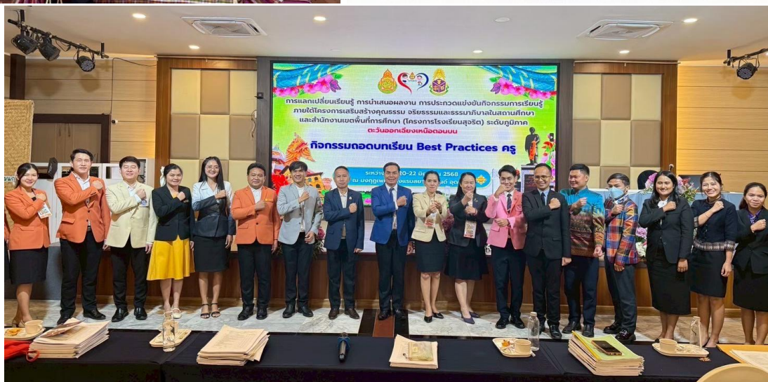
เข้าร่วมนำเสนอผลงาน แลกเปลี่ยนเรียนรู้โครงการโรงเรียนสุจริต ระดับภาคตะวันออกเฉียงเหนือ ปี ๒๕๖๘