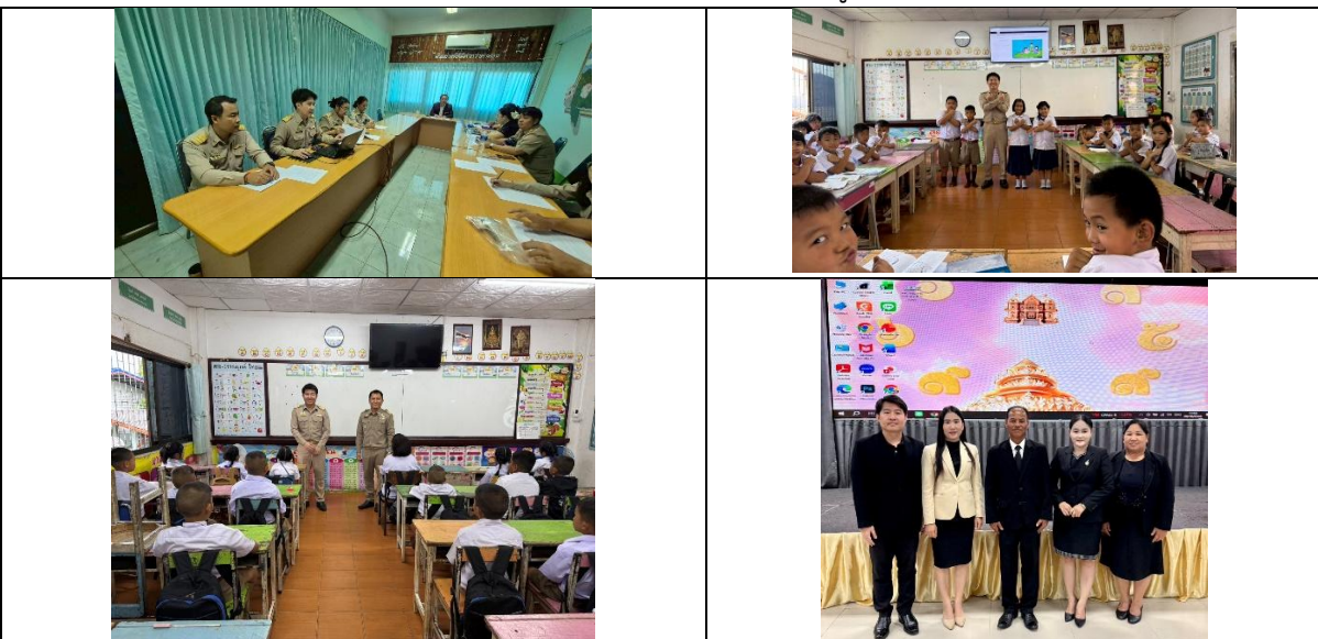
การนิเทศภายใน การจัดการเรียนรู้วิชาเพิ่มเติมการป้องกันการทุจริต จากผู้บริหารสถานศึกษา ในการเรียนรู้บนแพลตฟอร์มออนไลน์ ของสำนักงาน ป.ป.ช.

ผลงานนวัตกรรมก่อให้เกิดประโยชน์ประสพการณ์การเรียนรู้ร่วมกันทั้งในและนอกองค์กร ดังนี้