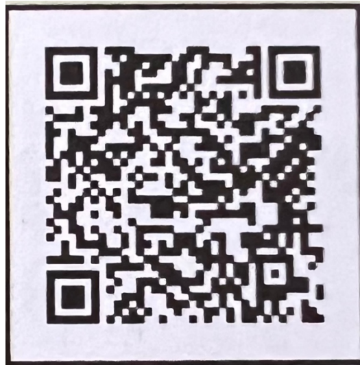
QR-Code ไฟล์เสียงคำศัพท์