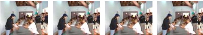
โดย: หม่ากิเลส

ปัญหาของคนอีสานมีมากในเรื่องของการศึกษา คนอีสานส่วนมากไม่ยอมให้ลูกเป็นคนอีสาน ไม่ยอมให้ลูกเป็นคนบ้านนอก ไม่ยอมให้ลูกพูดภาษาอีสาน อยากให้พูดไทย ชาวบ้านสวนมาก คิดอยากให้ลูกได้ดีในชีวิต คิดว่าสิ่งที่ดีในชีวิตของลูกคือ ๑. ไม่ได้พูดอีสาน พูดแต่ภาษาไทย ๒. พูดภาษาอังกฤษด้วย ๓. เล่นคอมพิวเตอร์ได้ ๔. ไปอยู่ในเมือง ๕. ไปรับจ้างเขา ๖. ไปสร้าง หนี้สิน ไปซื้อบ้านหลังเล็กๆ ราคา ๒ ล้าน ๓ ล้านบาท เขาคิดว่า อย่างนี้ลูกของเขาได้ดี ซึ่งผมไม่เห็นด้วย ผมก็อยากให้ลูกของผมได้ดีเหมือนกัน แต่ภาษาอังกฤษ ไม่ใช่ปัจจัย ที่จะช่วยให้เขา ได้ชีวิตที่ดี อาจจะไปแลกเงินในบางช่วงได้ แต่ผมหวังว่า ลูกของผม จะมีความคิด สูงกว่านั้น ชีวิตน่าจะมีไว้เพื่อหาสิ่งที่ไม่ใช่เงิน ถ้าเขาเรียนรู้อะไร จะหาเงิน อย่างเดียวกันเสียใจนะ เพราะความรู้เป็นสิ่งสำคัญที่สุด แต่การเรียนรู้อะไร เป็นสิ่งที่เราต้องทำ ทุกวันตลอดชีวิต เราหยุดเรียนรู้อะไรไม่ได้ แต่เราไม่หาจะเรียน เพื่อเอาความรู้ เอาปริญญา ไปแลกกับเงิน ทำให้ความรู้ไม่มีคุณค่า