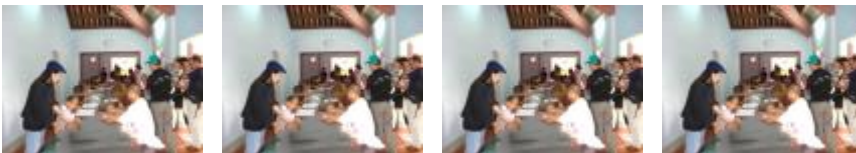
โดย: หม่ากิเลส

ปัญหาของคนอีสานมีมากในเรื่องของการศึกษา คนอีสานส่วนมากไม่ยอมให้ลูกเป็นคนอีสาน ไม่ยอมให้ลูกเป็นคนบ้านนอก ไม่ยอมให้ลูกพูดภาษาอีสาน อยากให้พูดไทย ชาวบ้านสวนมาก คิดอยากให้ลูกได้ดีในชีวิต คิดว่าสิ่งที่ดีในชีวิตของลูกคือ ๑. ไม่ได้พูดอีสาน พูดแต่ภาษาไทย ๒. พูดภาษาอังกฤษด้วย ๓. เล่นคอมพิวเตอร์ได้ ๔. ไปอยู่ในเมือง ๕. ไปรับจ้างเขา ๖. ไปสร้าง หนี้สิน ไปซื้อบ้านหลังเล็กๆ ราคา ๒ ล้าน ๓ ล้านบาท เขาคิดว่า อย่างนี้ลูกของเขาได้ดี ซึ่งผมไม่เห็นด้วย ผมก็อยากให้ลูกของผมได้ดีเหมือนกัน แต่ภาษาอังกฤษ ไม่ใช่ปัจจัย ที่จะช่วยให้เขา ได้ชีวิตที่ดี อาจจะไปแลกเงินในบางช่วงได้ แต่ผมหวังว่า ลูกของผม จะมีความคิด สูงกว่านั้น ชีวิตน่าจะมีไว้เพื่อหาสิ่งที่ไม่ใช่เงิน ถ้าเขาเรียนรู้อะไร จะหาเงิน อย่างเดียวกันเสียใจนะ เพราะความรู้เป็นสิ่งสำคัญที่สุด แต่การเรียนรู้อะไร เป็นสิ่งที่เราต้องทำ ทุกวันตลอดชีวิต เราหยุดเรียนรู้อะไรไม่ได้ แต่เราไม่หาจะเรียน เพื่อเอาความรู้ เอาปริญญา ไปแลกกับเงิน ทำให้ความรู้ไม่มีคุณค่า