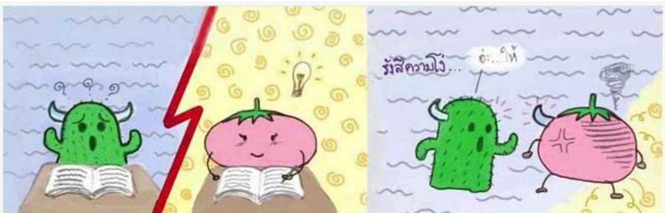
ฉันอาจมีเขา แต่เธอไม่มีเขา.... ฉันแบ่งเขาให้เธอหนึ่งอัน เพราะฉันมีน้ำใจ