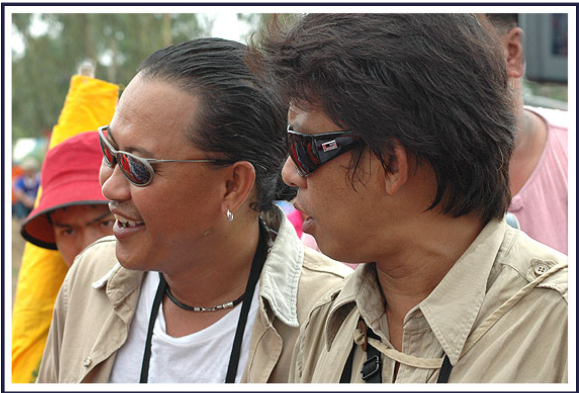
เอ๊ะใครเนี่ย!!...คันทันนะ เอ้า...ลุ้นๆๆๆช่วยกันลุ้น