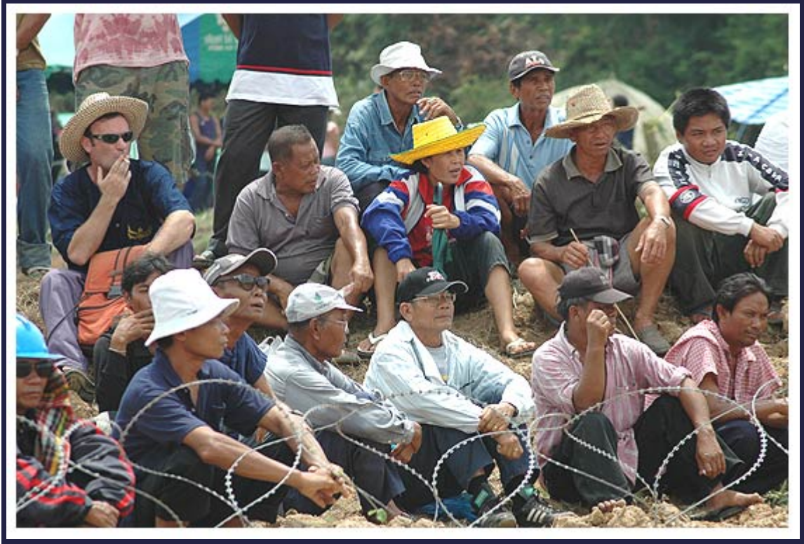
นั่งรอดูการจุดบั้งไฟ...ลุ้นๆๆให้บั้งไฟขึ้นลับฟ้าไปเลย.....