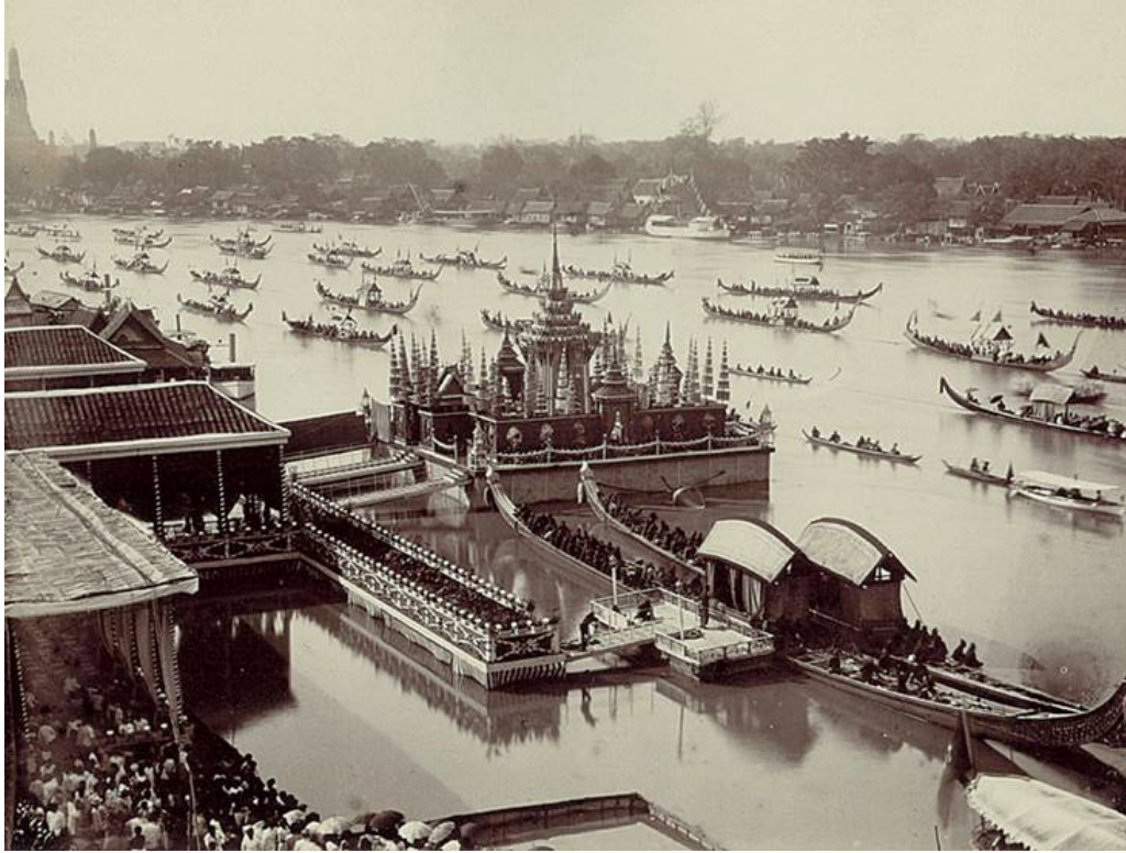
ภาพมุมสูงในวันที่ 14 มกราคม พ.ศ. 2429 ซึ่งเป็นวันที่ 4 ของ การพระราชพิธีมหาพิไชยมงคล ลงทรงสนับพระปรมาภิไธย ในสมเด็จพระเจ้าลูกยาเธอ เจ้าฟ้าพระราชกุมารพระองค์ใหญ่ (สมเด็จพระเจ้าลูกยาเธอ เจ้าฟ้ามหาวชิรุณหิศ)