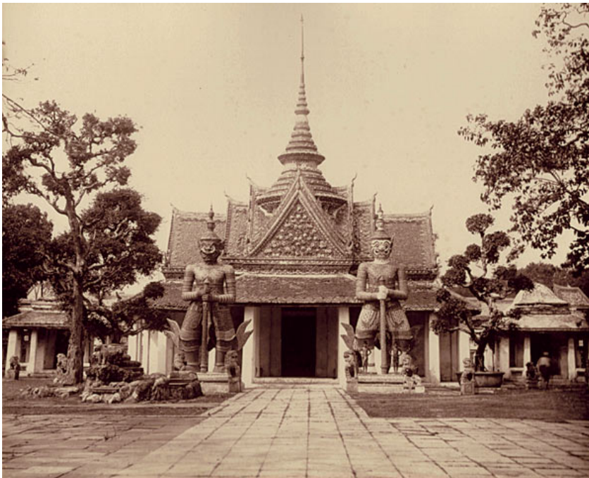
ซุ้มประตูยอดมงกุฎทางเข้าพระอุโบสถวัดอรุณราชวราราม หรือ วัดแจ้ง มีทวารบาลยักษ์ คือ ทศกัณฐ์ด้านซ้าย และสหัสเดชะด้านขวา ปี พ.ศ.2410