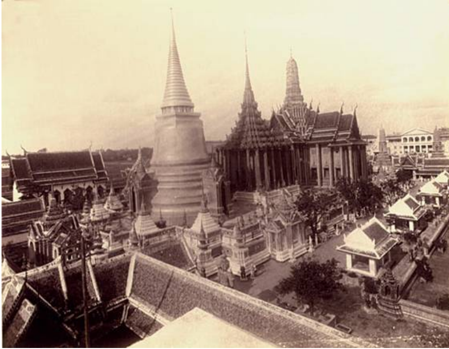
ส่วนหนึ่งของวัดพระศรีรัตนศาสดาราม บริเวณปราสาทพระเทพบิดร พระมณฑปซึ่งเป็นที่ประดิษฐานพระไตรปิฎก และพระศรีรัตนเจดีย์ ซึ่งบรรจุพระบรมสารีริกธาตุ พ.ศ. 2423