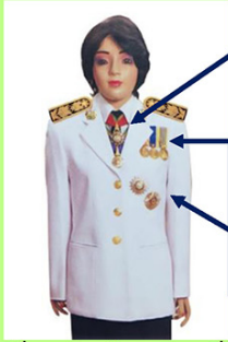
เครื่องแบบเต็มยศและครึ่งยศ

เช่น ท.ช., ท.ม. (เดิมประดับหน้าบ่าล้อมีดารา)