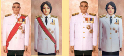
ปม - ปช. สหภาพข้าราชฯ มวม - มปช. สหภาพข้าราชฯ

ประดับตราที่มีลำดับเกียรติสูงสุดไว้ใกล้แนวรั้งคุม ส่วนตราที่มีลำดับเกียรติรองลงไป ประดับต่ำกว่า หรือเยื้องไปทางซ้ายของลำดับ