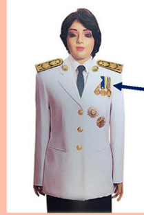
เครื่องแบบครึ่งยศ

เหรียญราชอิสริยาภรณ์ เช่น เหรียญจักรพรรดิมาลา เหรียญที่พระราชทานเป็นที่ระลึก ในโอกาสต่าง ๆ ให้ประดับโดยใช้แพรแถบ แบบบุรุษ