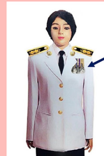
เครื่องแบบเต็มยศและครึ่งยศ

ประดับแพรแถบ เหรียญที่พระราชทานเป็นที่ระลึก ในโอกาสต่าง ๆ แบบบุรุษ ที่อกเสื้อเบื้องซ้าย