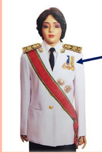
เครื่องแบบเต็มยศ

ประดับดารา ดวงตรา และสวมสายสะพายเช่นเดิม