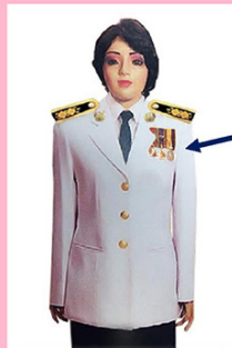
เครื่องแบบเต็มยศและครึ่งยศ

เช่น จ.ช., จ.ม., ป.ช., บ.ม., ร.ท.ช., ร.ท.ม., ร.จ.ช., ร.จ.ม.