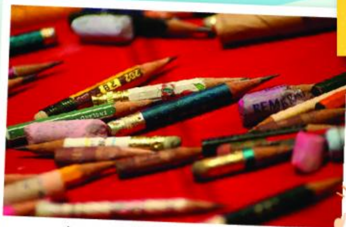
ชมสอนให้นักเรียนใช้ของอย่างประหยัดเหมือนในหลวง