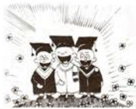
เด็กโรงเรียนสาธิต+มีความพร้อมสูง