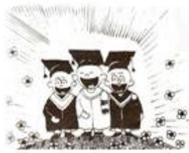
เด็กโรงเรียนสาธิต+มีความพร้อมสูง