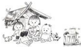
เด็กในสลัม+ครอบครัวแตกแยก