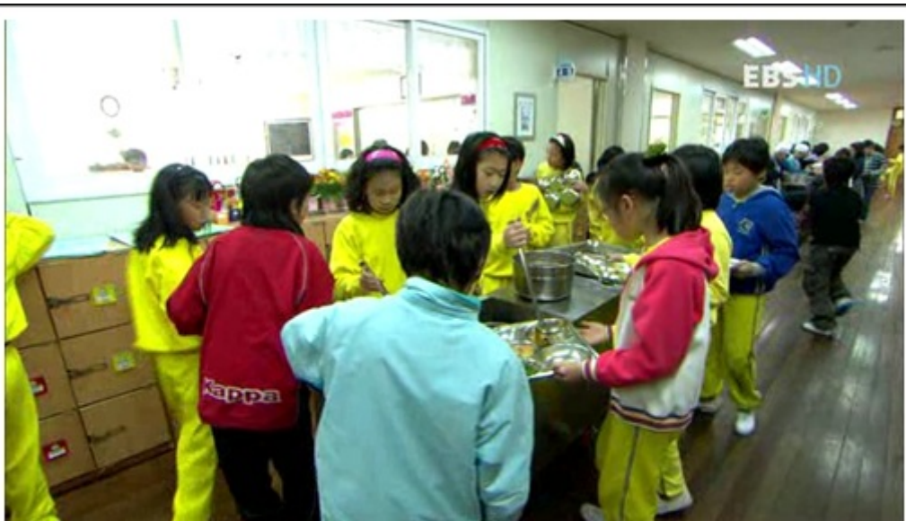
หลังจากจับฉลากเลือกที่นั่งแล้ว ก็ถึงเวลาพักกลางวันของเด็กๆ