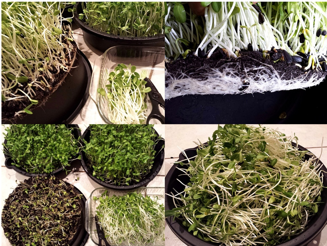
เวลาตัดรากก็ใช้กรรไกรตัดโลด รวบมาเป็นกำๆ แล้วก็ตัดจับๆๆ ล้างให้สะอาด ผึ่งให้แห้งสะเด็ดน้ำ