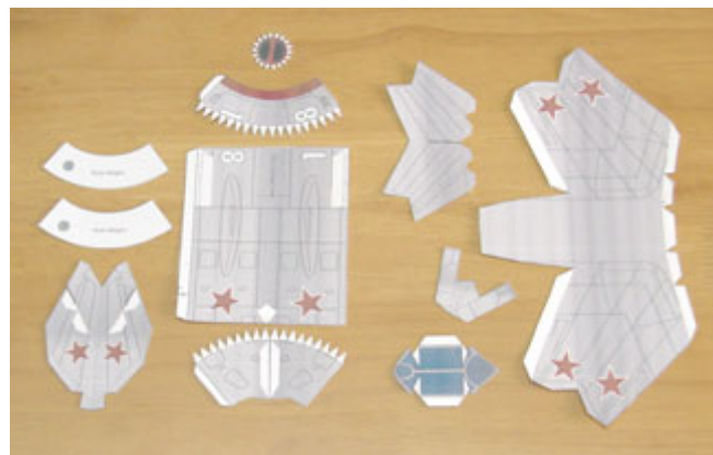
แสดงชิ้นส่วนต่างๆที่ตัดออกมาเรียบร้อยแล้ว

เมื่อตัดออกมาเสร็จแล้วก็จะได้ส่วนประกอบต่างๆดังภาพ ระหว่างที่ทำควรรหากลองใส่ชิ้นส่วนต่างๆดูจะได้ไม่หายไปไหน ผมใช้กล่องพลาสติกใสที่บังเอิญมีอยู่แล้วก็สะดวกดีครับเพราะกล่องใสเห็นส่วนประกอบที่วางอยู่ในกล่องเลย