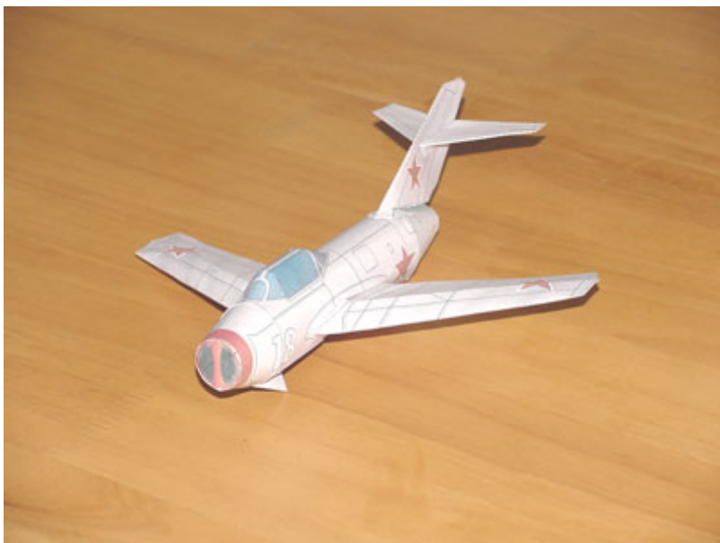
โฉมหน้าเครื่อง MIG 15 ที่ทำจากกระดาษ 80 แกรม