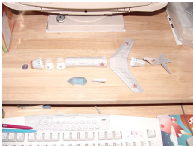
ภาพแสดงส่วนประกอบต่างๆที่ขึ้นรูปเสร็จเรียบร้อยแล้ว ในส่วนประกอบต่างๆประกอบเข้าด้วยกัน