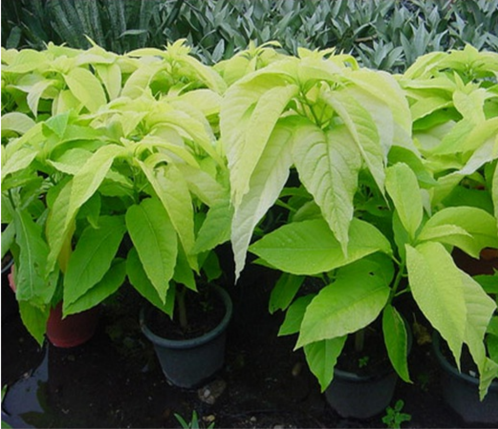
ภาพจาก ร้านต้นไม้ฮ่องเบลล์