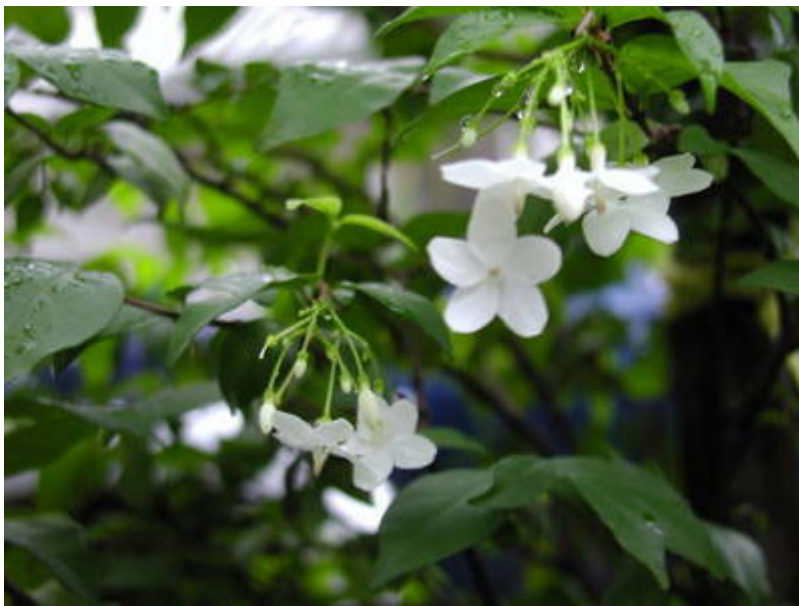
ภาพจาก วิกิพีเดีย

ไม้ดอกถือได้ว่าเป็นไม้ที่ให้ประโยชน์มากมาย นอกจากบางชนิดจะเพิ่มเติมความสวยงามให้กับบ้านแล้ว ยังมีกลิ่นหอมแตกต่างกันออกไปตามความชอบ แถมบางชนิดยังให้ร่มเงาได้อีกด้วยนะ หลายคนจึงนิยมปลูกต้นไม้เหล่านี้เอาไว้ริมรั้วเพื่อเพิ่มความสวยงามให้กับบ้านมากขึ้น ดังเช่นตัวอย่างต่อไปนี้