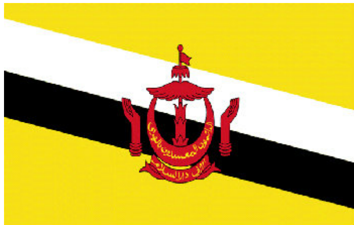
บรูไน ซาลามัต ดาตัง

ในปี 2558 ประเทศไทยก็จะก้าวเข้าสู่การเป็นประชาคมอาเซียน ซึ่งเมื่อถึงวันนั้นเราคงมีโอกาสที่พบเจอเพื่อนต่างชาติกันมากขึ้น ดังนั้นวันนี้พี่แกป้าเลยนำเอาคำกล่าวทักทายของแต่ละประเทศมาให้ทำความรู้จักกัน