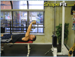
B. Lying Supinating Dumbbell Extensions