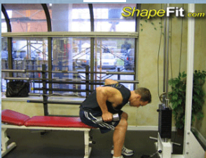
B. Seated Dumbbell Extensions