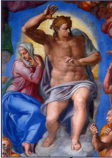
👉 ความคิดเห็นที่ 14 🛡️

ออกจากวาติกันมา จะต้องเห็นปราสาทแห่งนี้ที่ชื่อว่า Castel Sant'Angelo ที่จะไม่ได้อยู่ในกำแพงวาติกัน แต่ก็จะอยู่ในอาณาจักรของวาติกันตามสนธิสัญญาที่มุสโสลินีได้ให้ไว้