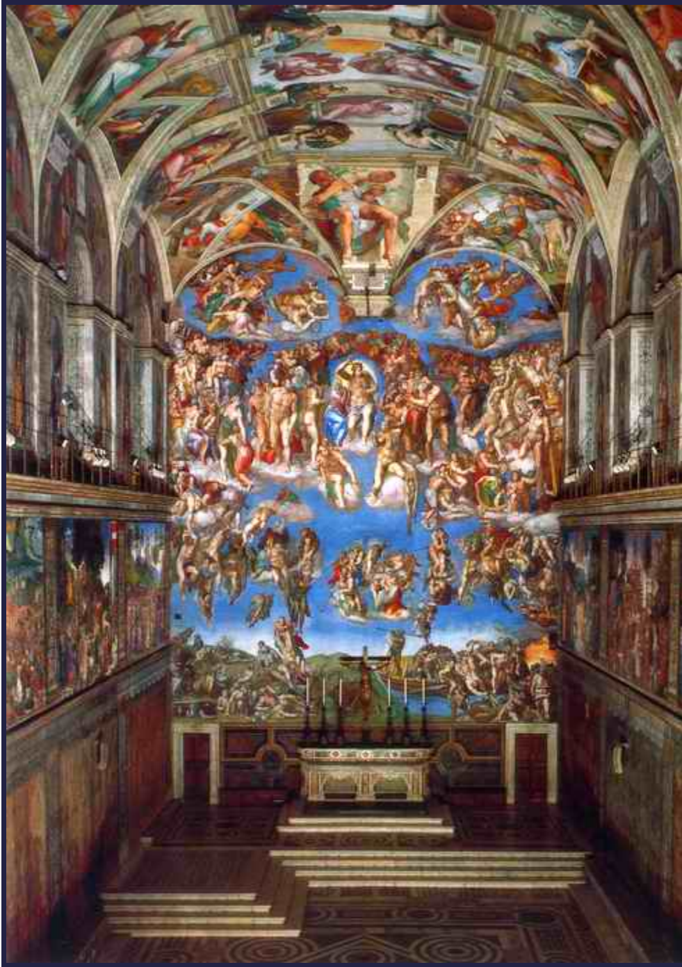
ศูนย์กลางของภาพคือพระเยซูคริสต์ ซึ่งวาดขึ้นตามสไตล์ของมิเกลันเจโล มนุษย์ผู้ชายจะล่ำ ๆ หน้า ๆ กล้ามโต ๆ ได้ยวบยงได้เห็นอีกเยอะครับ