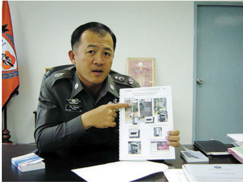
อุปกรณ์ตรวจจับแบบเลเซอร์ (Laser Sensor Module)