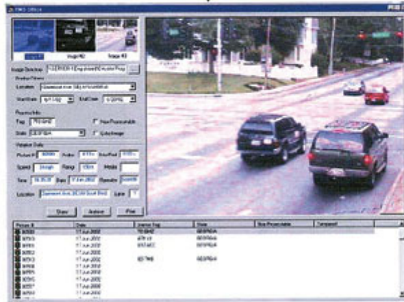
ระบบซอฟต์แวร์ปฏิบัติการนิคมหลายช่องทาง (Multi-lane Software Control)

เริ่มแล้ว! กล้องไฮเทค จับผิด 30 แยกทั่วกรุง ฝ่าไฟแดง-ปรับถึงบ้าน