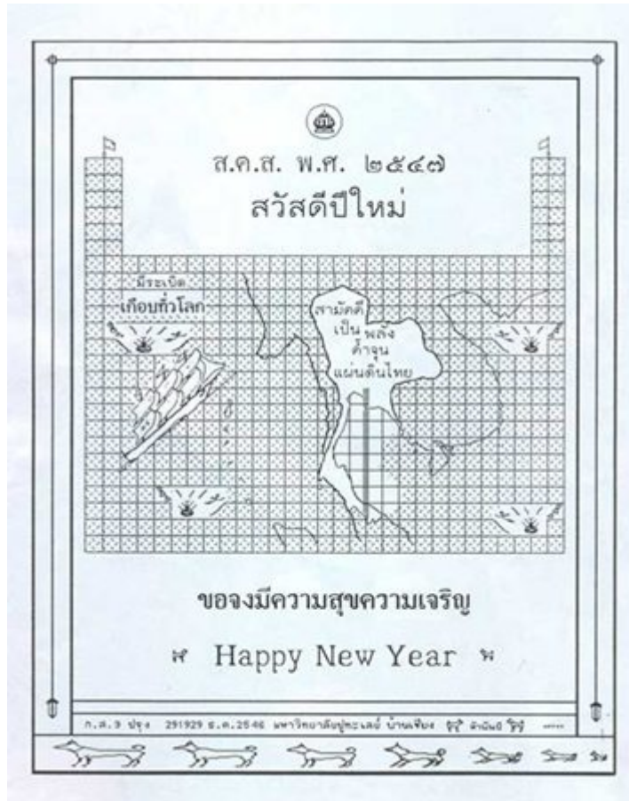
ส.ค.ส.พระราชทาน ปี พ.ศ.2547

สำหรับรูปแบบของ ส.ค.ส พระราชทานนั้น ในยุคแรกเป็น ส.ค.ส.ไม่มีลวดลาย สีขาวดำ มีข้อความปรากฏสั้นๆ ต่อมาจนถึงปี พ.ศ.2532 เริ่มมีลวดลายประดับประดา ส.ค.ส.มากขึ้น จนถึงในปี พ.ศ.2549 ได้ทรงพระกรุณาโปรดเกล้าฯ พระราชทานเป็นภาพสี