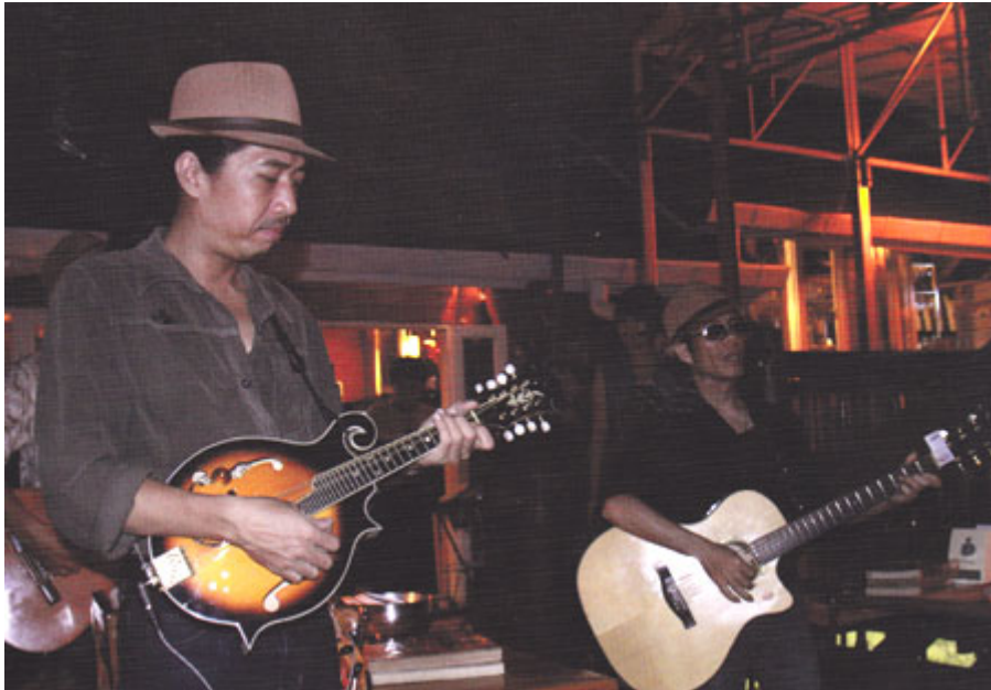
การเบี๊ยะแฟลช