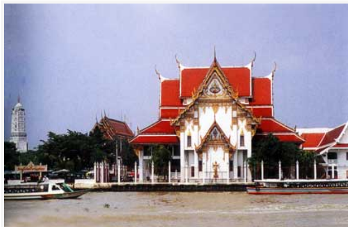
วัดระฆังโฆสิตาราม

ศาลเจ้าพ่อเสือ ไปสักการะ เจ้าพ่อเสือ เจ้าพ่อกวนอู เจ้าแม่ทับทิม ฯลฯ เพื่อเสริม "อำนาจบารมี" ด้วยรูป 18 ดอก บั๊ก 6 กระดาษ เทียนแดง 1 คู่ พวงมาลัย 1 พวง