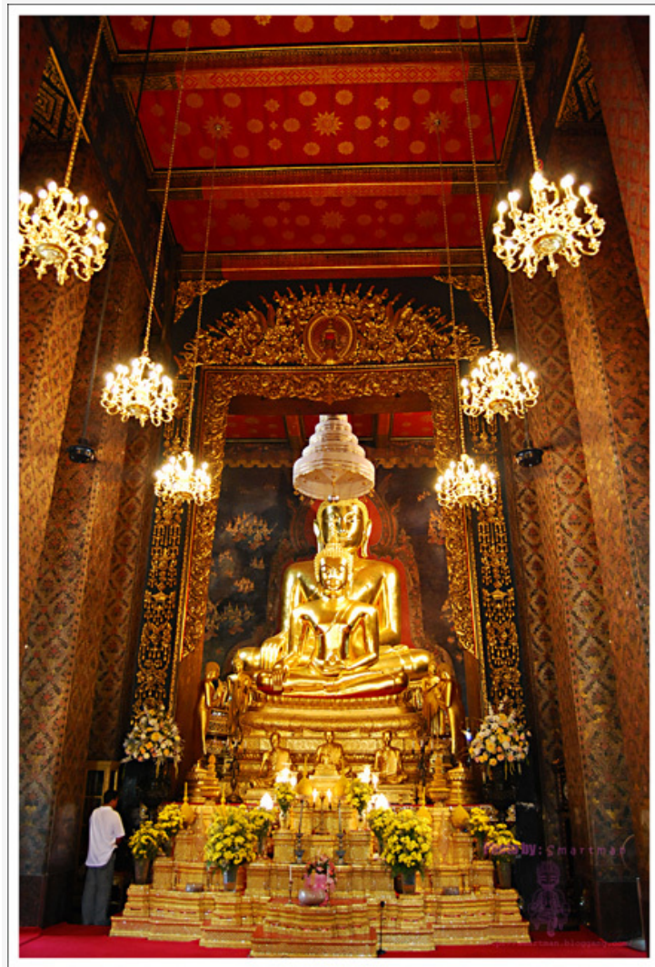
วัดชนะสงคราม

วัดชนะสงคราม ต้องไปสักการะ "พระประธาน" ในพระอุโบสถ และ "สมเด็จพระราชวังบูรพาภิรมย์" ด้วย รูป 5 ดอก เทียน 1 เล่ม ดอกบัว 1 ดอก มีความเชื่อว่า "จะมีชัยชนะต่ออุปสรรคทั้งปวง" ไหว้เสาหลักเมืององค์จำลอง ด้วยรูป 3 ดอก เทียน 1 เล่ม ผาแพรว 3 สี ดอกบัว และไหว้องค์จริงด้วยพวงมาลัย