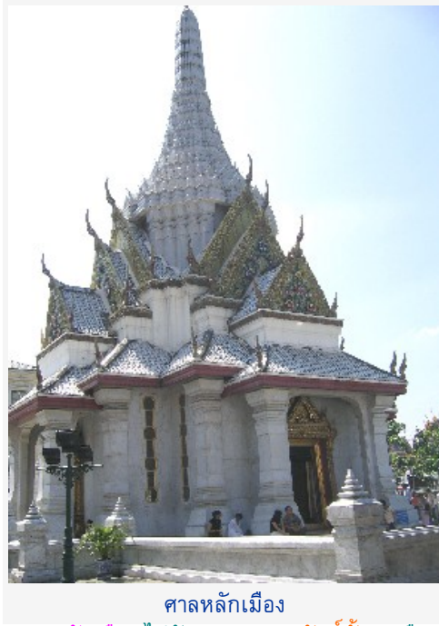
ศาลหลักเมือง

ศาลหลักเมือง ไปสักการะ "เทพารักษ์ทั้ง 5" คือ พระเสื้อเมือง, พระทรงเมือง, พระกาฬไชยศรี, เจ้าพ่อเจตคุปต์, เจ้าพ่อหอกลอง เพื่อ "ตัดเคราะห์ ตอชะตา เสริมวาสนาบารมี"