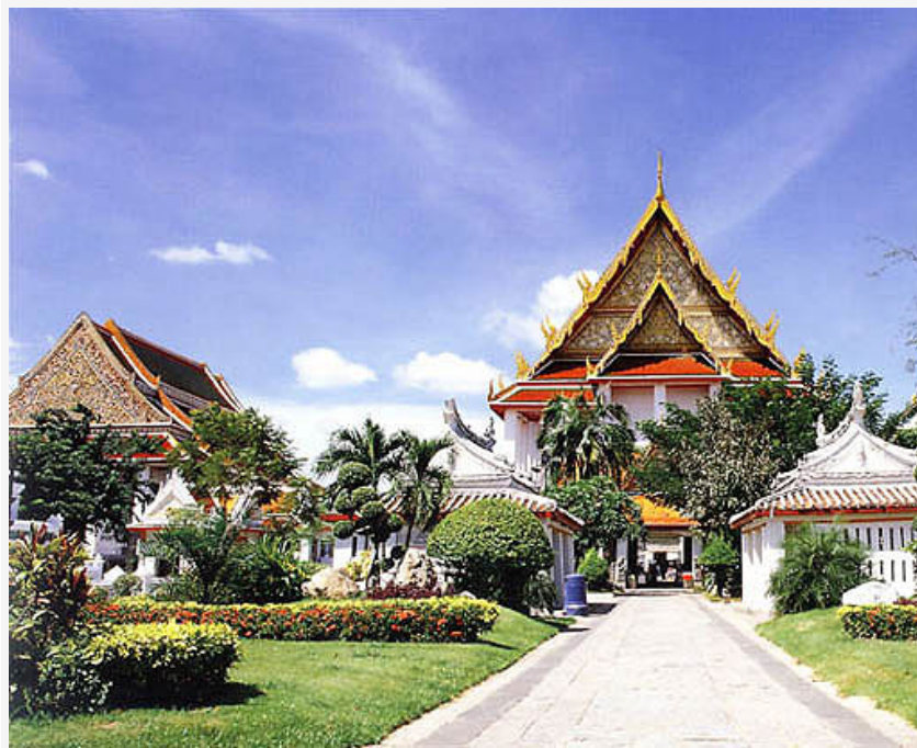
วัดกัลยาณมิตรวรมหาวิหาร

วัดอรุณราชวราราม ราชวรมหาวิหาร ต้องไปสักการะ "พระประธาน" ด้วยรูป 3 ดอก เทียนคู่ และต้องไปเดินทักษิณาวัดรอบ "พระปรางค์" อีก 3 รอบ เพื่อ "ชีวิตรุ่งโรจน์"