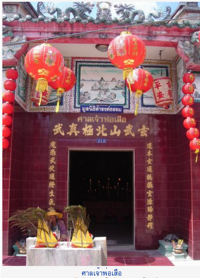
ศาลเจ้าพ่อเสือ

ศาลเจ้าพ่อเสือ ไปสักการะ เจ้าพ่อเสือ เจ้าพ่อกวนอู เจ้าแม่ทับทิม ฯลฯ เพื่อเสริม "อำนาจบารมี" ด้วยรูป 18 ดอก บั๊ก 6 กระดาษ เทียนแดง 1 คู่ พวงมาลัย 1 พวง