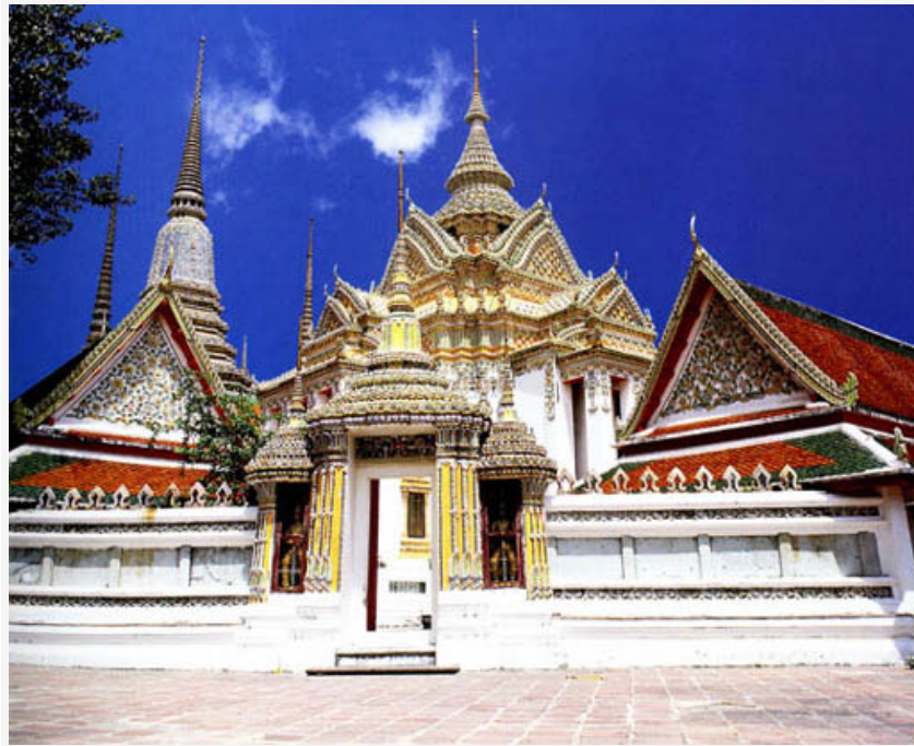
วัดพระเชตุพนวิมลมังคลาราม (วัดโพธิ์) วัดพระเชตุพนวิมลมังคลาราม (วัดโพธิ์) ต้องไปไหว้ "พระพุทธรูปไสยาสน์" เพื่อ "ความสงบสุขร่มเย็น" ด้วยรูป 9 ดอก เทียนแดงดู ทองคำเปลว 11 แผ่น