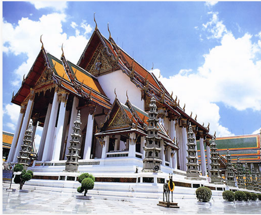
วัดสุทัศนเทพวราราม ราชวรมหาวิหาร เพื่อ "วิสัยทัศน์กว้างไกล มีเส้นที่แก่นั่นทั่วไป" ต้องไปสักการะ "พระศรีศากยมุนี" ด้วยรูป 3 ดอก เทียน 2 เล่ม ดอกบัวหรือพวงมาลัย