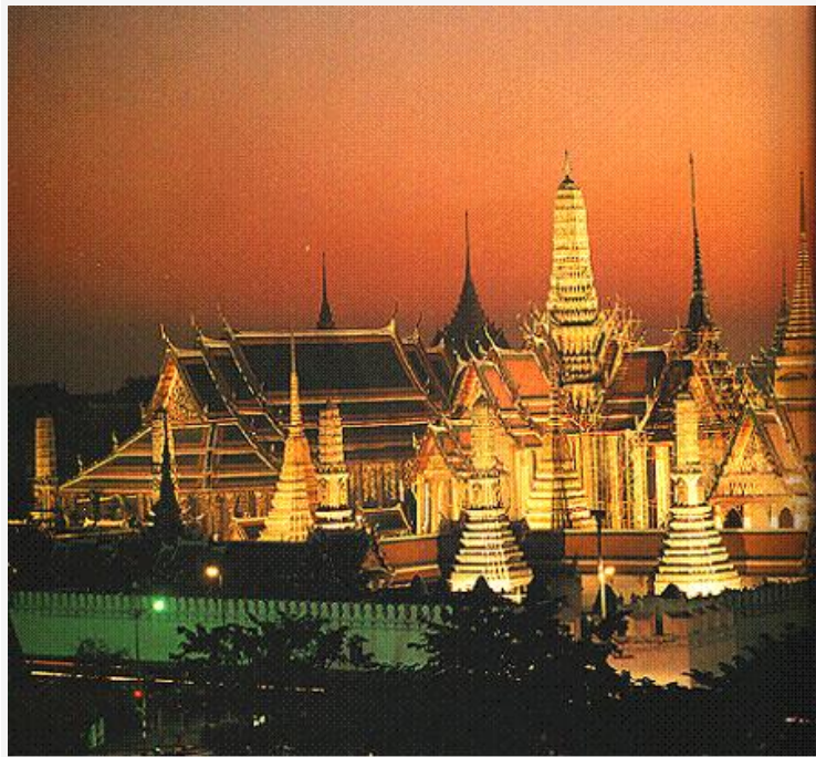
วัดพระศรีรัตนศาสดาราม

ศาลหลักเมือง ไปสักการะ "เทพารักษ์ทั้ง 5" คือ พระเสื้อเมือง, พระทรงเมือง, พระกาฬไชยศรี, เจ้าพ่อเจตคุปต์, เจ้าพ่อหอกลอง เพื่อ "ตัดเคราะห์ ตอชะตา เสริมวาสนาบารมี"