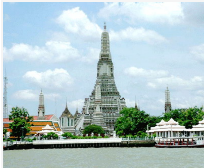
วัดอรุณราชวราราม ราชวรมหาวิหาร

วัดอรุณราชวราราม ราชวรมหาวิหาร ต้องไปสักการะ "พระประธาน" ด้วยรูป 3 ดอก เทียนคู่ และต้องไปเดินทักษิณาวัดรอบ "พระปรางค์" อีก 3 รอบ เพื่อ "ชีวิตรุ่งโรจน์"