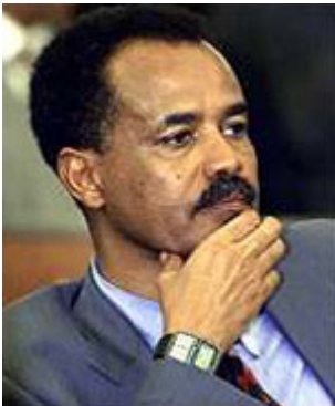
อิซาเยียส อาเฟเวอร์กี (Isaias Afewerki)

ขึ้นชื่อว่าเป็นประเทศสงครามกลางเมืองอยู่แล้ว ยังโดนผู้นำเจ้าปัญหาอีก เมื่อไม่กี่เดือนที่ผ่านมาประธานาธิบดีมุฮัมมัด นาซาร์วาดี ประกาศใช้รัฐธรรมนูญชั่วคราว ปิดศาล และไล่ม้าจับกุมคนที่ต่อต้านเขา นับพันคน พร้อมกฎหมายยกเลิกการเลือกตั้ง และแต่งตั้งตนเองเป็นประธานาธิบดีต่อไปอีกเรื่อยๆ นอกจากนี้ยังอุทสาห์ยังใจดีอนุญาตให้อดีตนายก นาวาซ ชารีฟ และเบนาลีร์ บุตโต กลับมาจากการลี้ภัยในต่างประเทศต่อพ้อทั้งสองกลับมากลับเป็นว่านายชารีฟโดนกีดไม่ให้ลงเลือกตั้ง สวนบุดโตหนักกว่าเพราะโดนระเบิดตายอย่างสยดสยอง