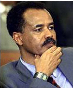
อิซาเยิส อาเฟเวอร์กี (Isaias Afewerki)

ขึ้นชื่อว่าเป็นประเทศสงครามกลางเมืองอยู่แล้ว ยังโดนผู้นำเจ้าปัญหาอีก เมื่อไม่กี่เดือนที่ผ่านมา ประธานาธิบดีมุฮัมมัด ซาฟเวร์ได้อำนาจคืนให้ประธานาธิบดี และไล่ม้าจับกุมคนที่ต่อต้านเขา นับพันคน พร้อมกฎหมายยกเลิกการเลือกตั้ง และแต่งตั้งตนเองเป็นประธานาธิบดีต่อไปอีกเรื่อยๆ นอกจากนี้ยังอุทสาห์ยังใจดีอนุญาตให้อดีตนายก นาวาซ ชารีฟ และเบนาลีร์ บูตโต กลับมาจากการลี้ภัยในต่างประเทศต่อพ้อทั้งสองกลับมากลับเป็นว่านายชารีฟโดนกีดไม่ให้ลงเลือกตั้ง ส่วนบูตโตหนักกว่าเพราะโดนระเบิดตายอย่างสยดสยอง