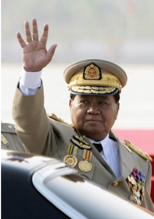
ตาน ฉ่วย (Ban Owe)

อายุ 75 ปี ประเทศพม่า ครองอำนาจมาตั้งแต่ปี 2535