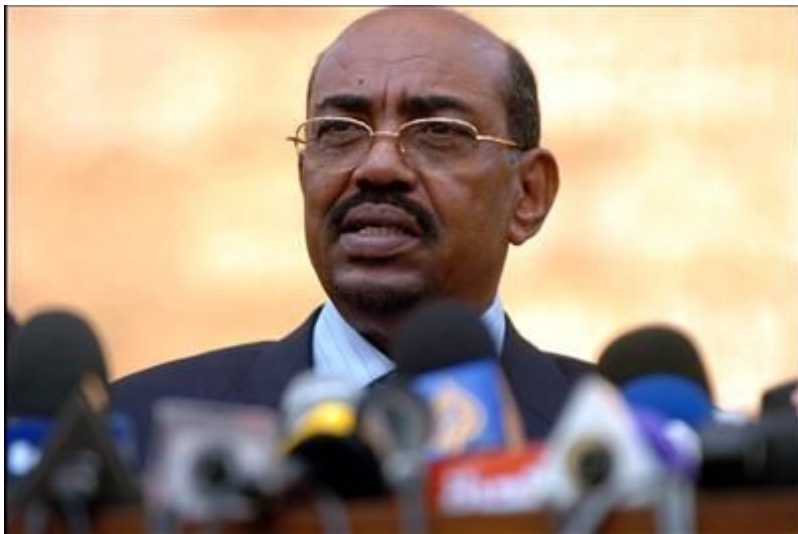
โอมาร์ อัล บาชีร์

หลังจากหมดยุคฮิตเลอร์ สตาลิน เหมาเจ๋อตุง พรพต ดาดำ ฮามิน แล้วโลกเราก็ไม่ยังสงบสุขซะทีเดียวเพราะผู้นำที่เป็นคนชั่ว คนเลว โจรคู่จิต โลก ปกครองประเทศอยู่เยอะ โกงกินประเทศก็มาก(แม่ปากบอกวาร์กชาติก็เถอะ) ผมเลยมารวบรวมผู้นำเผด็จการตัวเป้งๆ บนโลกบวมๆ ใหญ่ไว้วาถาประชาชนในประเทศนั้นขาดความสามัคคี จะเกิดอะไรขึ้น!!