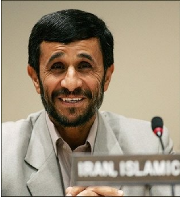
ซาอิด อาลี ไคไมลี

อายุ 68 ปีอิหร่าน ครองอำนาจมาตั้งแต่ปี 2532