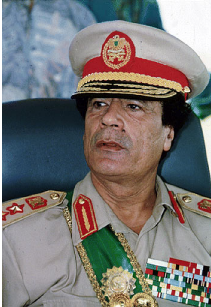
มูอัมมาร์ อัล กัดดาฟี (Muammar Al-Gaddafi)

ดูภายนอก นาซาร์ อัล อัสซัด ดูไม่เหมือนจอมเผด็จการสักนิด เพราะเขาได้อำนาจมาจากพ่อผู้นำจอมเผด็จการตัวจริงเสียงจริง ซึ่งเรียกเขากลับมาฝึกหัดงานบริหารประเทศในปี 1994 ซึ่งตอนนั้นเขากำลังเรียนปริญญาโทในลอนดอน จนกระทั่งปัจจุบันอัล อัสซัด กลายเป็นคนกุมอำนาจด้านการทหารและหน่วยข่าวกรองอย่างเด็ดขาดผู้เดียวในซีเรีย และรัฐบาลเขายังมีส่วนเกี่ยวข้องกับการลอบสังหารบุคคลสำคัญในประเทศเลบานอน