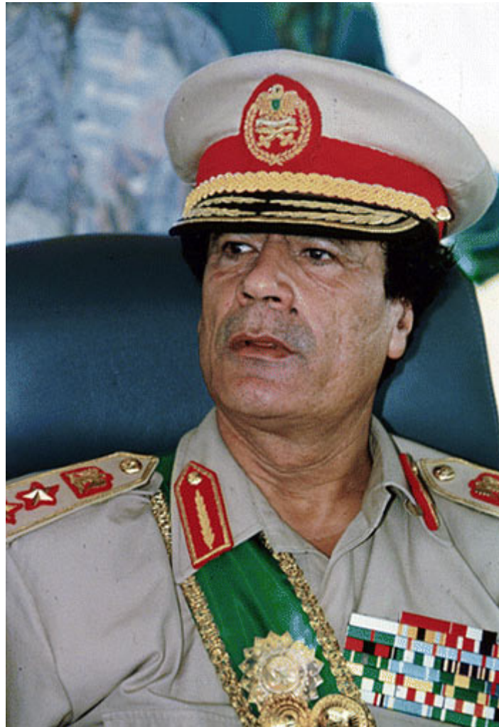
มูอัมมาร์ อัล กัดดาฟี (Muammar Al-Gaddafi)

ดูภายนอก นาซาร์ อัล อัสซัด ดูไม่เหมือนจอมเผด็จการสักนิด เพราะเขาได้อำนาจมาจากพ่อผู้นำจอมเผด็จการตัวจริงเสียงจริง ซึ่งเรียกเขากลับมาฝึกหัดงานบริหารประเทศในปี 1994 ซึ่งตอนนั้นเขากำลังเรียนปริญญาโทในลอนดอน จนกระทั่งปัจจุบันอัล อัสซัด กลายเป็นคนกุมอำนาจด้านการทหารและหน่วยข่าวกรองอย่างเด็ดขาดผู้เดียวในซีเรีย และรัฐบาลเขายังมีส่วนเกี่ยวข้องกับการลอบสังหารบุคคลสำคัญในประเทศเลบานอน