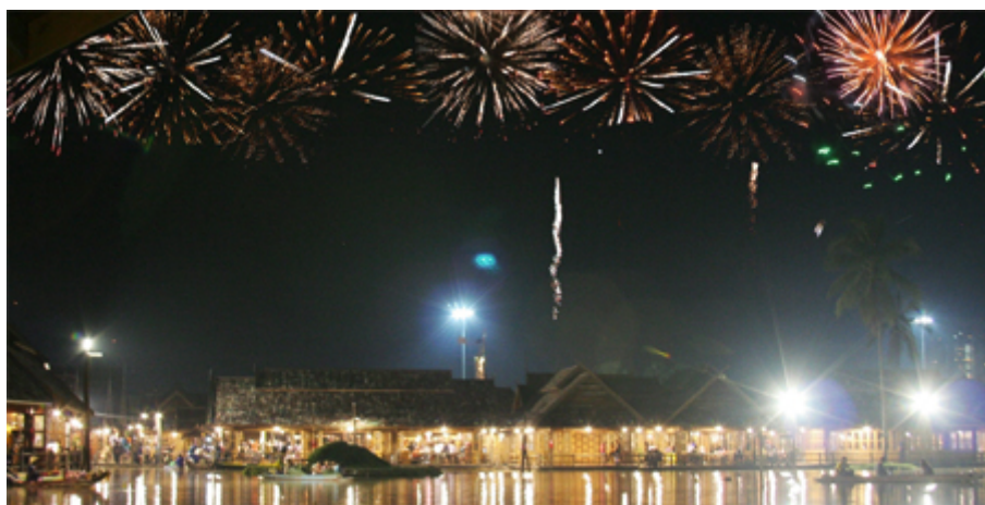
ตลาดน้ำสีภาค