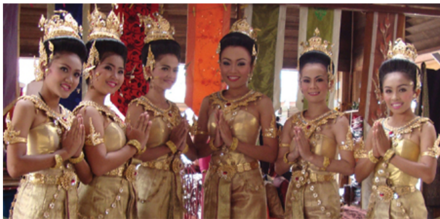
ตลาดน้ำสีภาค