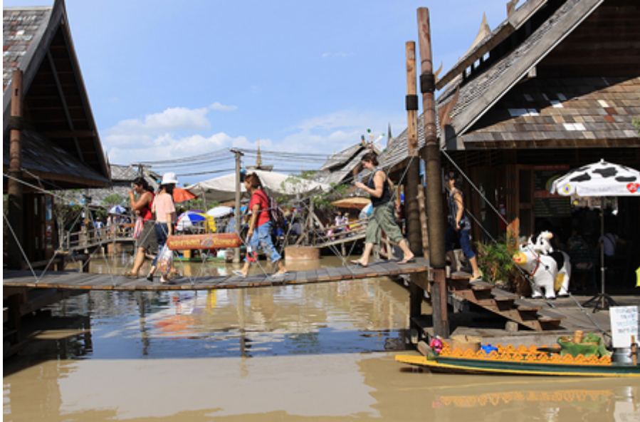
ตลาดน้ำสี่ภาค