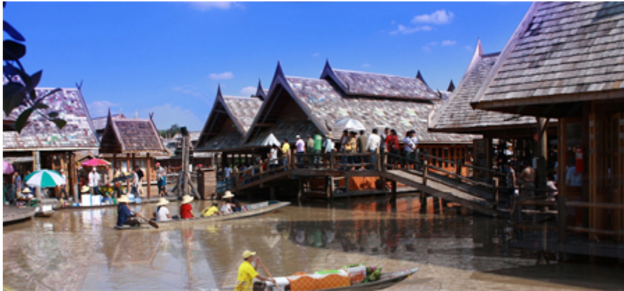
ตลาดน้ำสี่ภาค