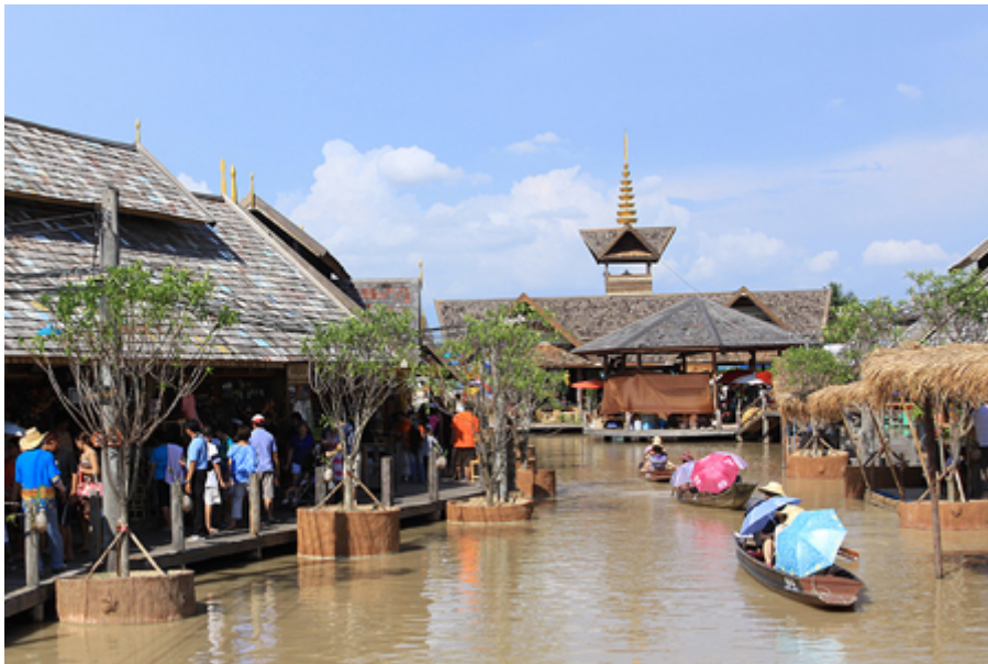
ตลาดน้ำสี่ภาค

โดยสินค้าทั้ง 4 ภาค จะแตกต่างกันออกไปตามวิถีชีวิตแต่ละภาค โดยภาคเหนือจะเป็นสินค้างานไม้แกะสลัก เครื่องเงิน ผ้าพื้นเมืองลวดลายงดงามวิจิตร ผ้าไหม และร่มกระดาษ สำหรับสินค้าภาคกลาง ได้แก่ เพอร์นิเจอร์หวาย เครื่องประดับ กระเป๋าสาน ภาคอีสานโดดเด่นในกลุ่มสินค้าผ้าไหมหมัดหมี่ ผ้าไหมแพรวา เทียนหอม หมอนอิง และภาคใต้สินค้าเครื่องชื้อได้แก่ ผลิตภัณฑ์จากมะพร้าว ผาบาติก เรือไม้จำลอง