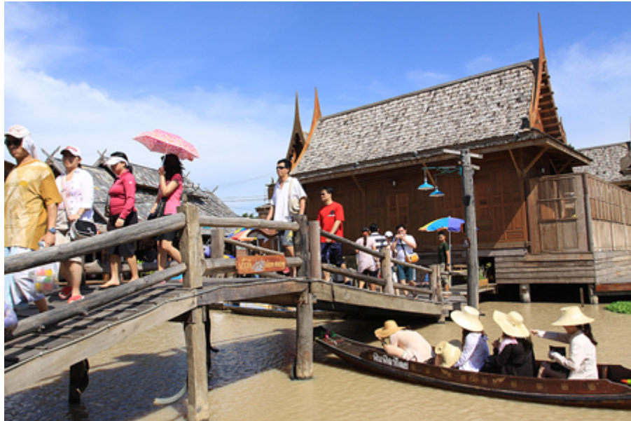
ตลาดน้ำสี่ภาค

อีกทั้งยังเล็งเห็นว่าควรจะนำเอาของดีของแต่ละแห่งทั้ง 4 ภาค มารวมไว้ด้วยกัน จึงกลายมาเป็น "ตลาดน้ำสี่ภาค" สถานที่ท่องเที่ยวเชิงวัฒนธรรม แหล่งรวมศิลปะ วัฒนธรรม ประเพณี และสินค้าต่าง ๆ ทั้ง 4 ภาคของไทยเอามารวมไว้ด้วยกันได้อย่างลงตัว