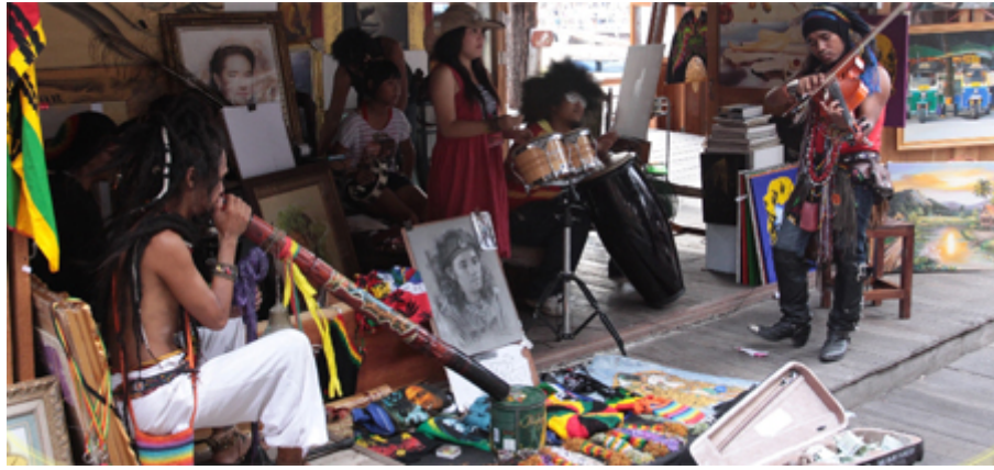
ตลาดน้ำสีภาค