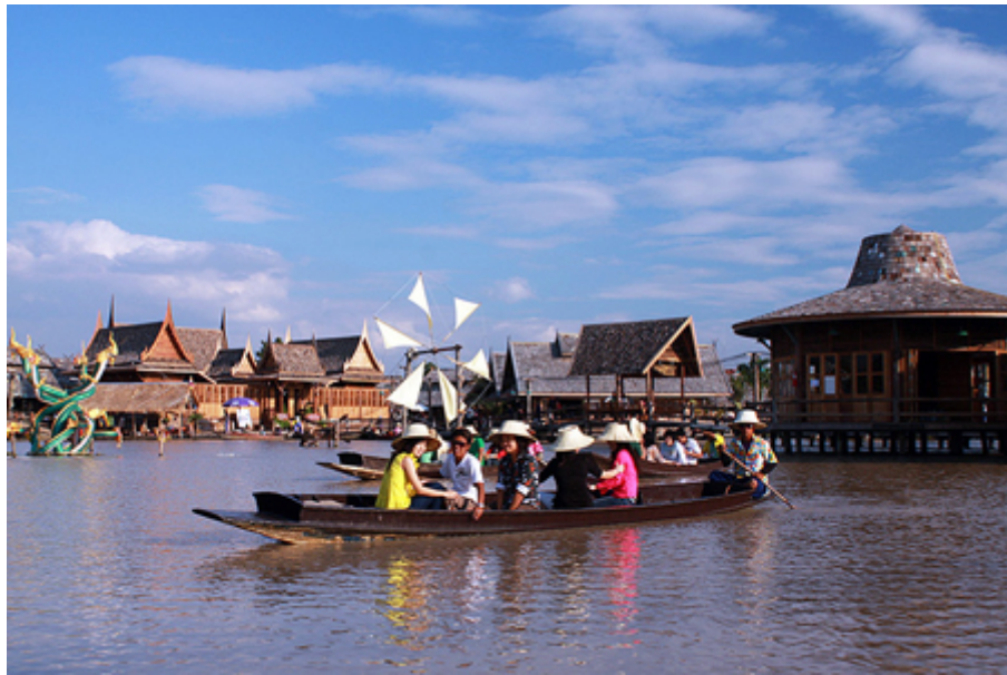
ตลาดน้ำสี่ภาค

ตลาดน้ำสี่ภาค ตั้งอยู่เลยพัทยาใต้ไปทางสัตหีบเพียงไม่ถึง 10 กิโลเมตร ถูกสร้างขึ้นบนพื้นที่กว่า 23 ไร่ริมถนนสุขุมวิท แต่เดิมพื้นที่ดังกล่าวเป็นปากกขนาดใหญ่ ต่อมามีการรื้อปากกออกเพื่อปรับปรุงพื้นที่ จึงรู้ว่าภายใต้ปากกที่รกรุงรังยังมีบึงธรรมชาติขนาดใหญ่อยู่ เลยเกิดไอเดียบรรเจิดเนรมิตรบึงแห่งนี้ให้กลายเป็น "ตลาดน้ำ" ให้ทุกคนได้สัมผัสความเป็นไทย ๆ จึงจำลองวิถีชีวิตความเป็นอยู่อย่างไทยที่เรียบง่าย เพื่อให้ทุกคนได้เรียนรู้วิถีพอเพียงดั้งเดิมที่ผูกพันกับสายน้ำตั้งแต่อดีตสืบทอดมาจนถึงปัจจุบัน