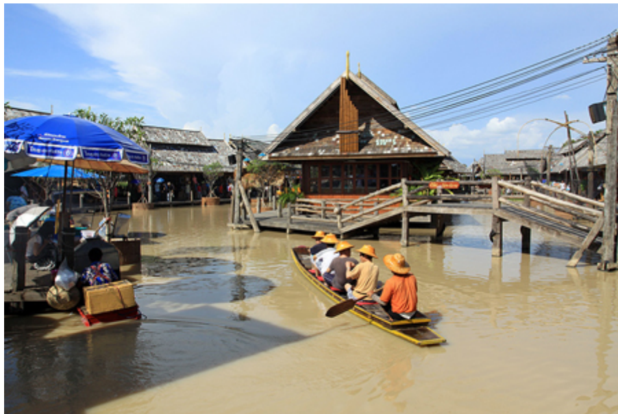
ตลาดน้ำสี่ภาค