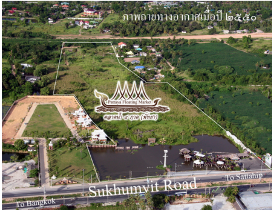
ตลาดน้ำสี่ภาค