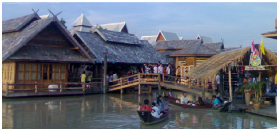
ตลาดน้ำสี่ภาค