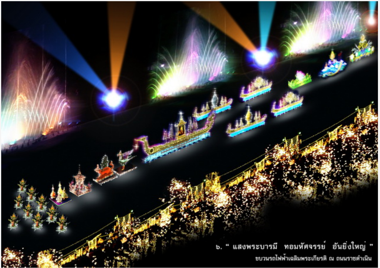
๖. “ แสงพระบารมี ทอมหัตถจารย์ อันยิ่งใหญ่ ” ขบวนการไฟฟ้าเฉลิมพระเกียรติ ณ ถนนราชดำเนิน