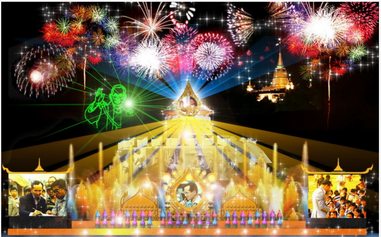
๔. “ แสงพระบารมี ร้อยใจมั่น ถวายพระพรชัย ” พิธีการจุดเทียนชัยถวายพระพร วันที่ ๕ ธ.ค. ๕๒ ณ เวทีกลาง บ่อนมหาภาพ