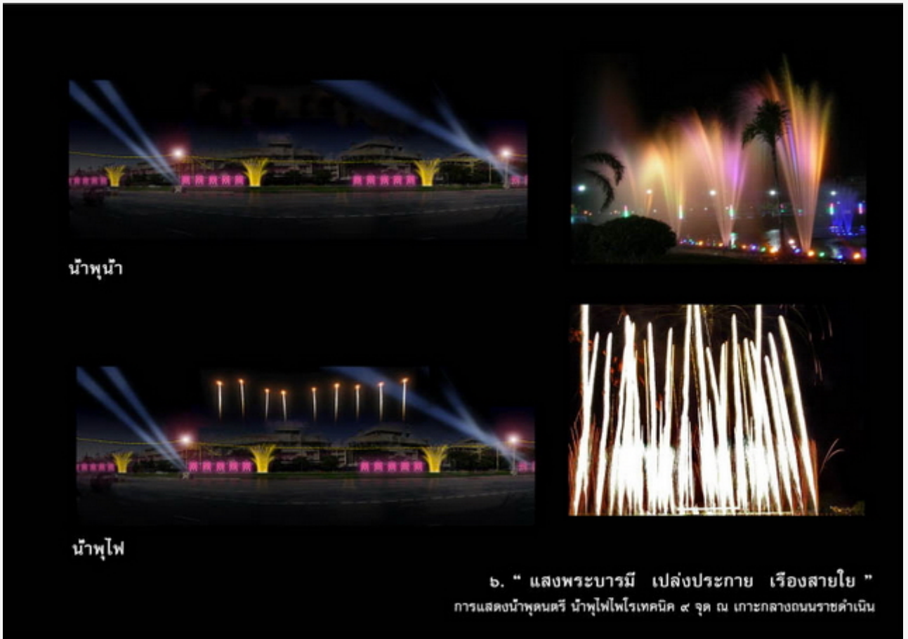
น้ำพุน้ำ