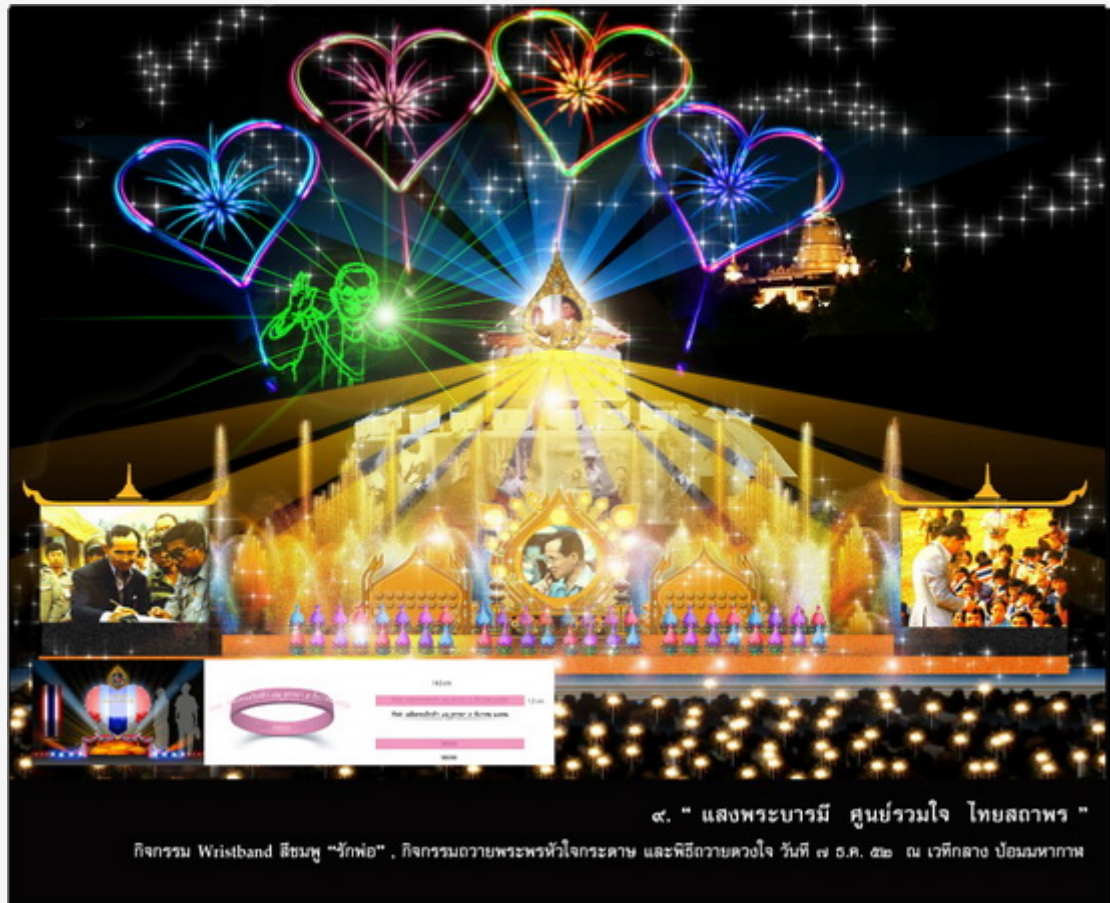
๙. " แสงพระบารมี ศูนย์รวมใจ ไทยสถาพร "

กิจกรรม Wristband สีชมพู "รักพ่อ", กิจกรรมถวายพระพรหัวใจกระดาษ และพิธีถวายดวงใจ วันที่ ๗ ธ.ค. ๕๖ ณ เวทีกลาง ป้อมมหากาฬ