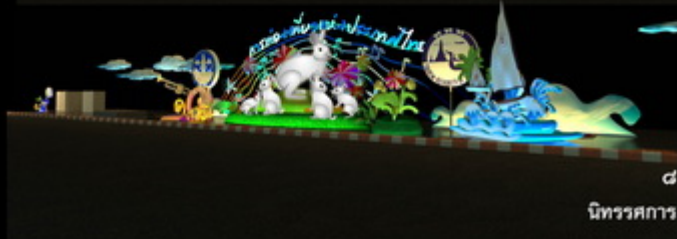
๘. " แสงพระบารมี ฉายพระราชมณียกิจ สกิดไฟท " นิทรรศการเฉลิมพระเกียรติฯ ของกระทรวงและทุกหน่วยงาน ๒ ฟากถนนราชดำเนิน