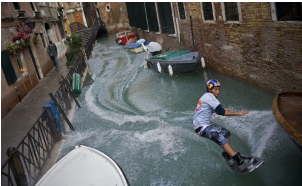
- ได้ใจจริงๆ กับลีลา wakeboard ในคลองเล็กๆ แบบนี้