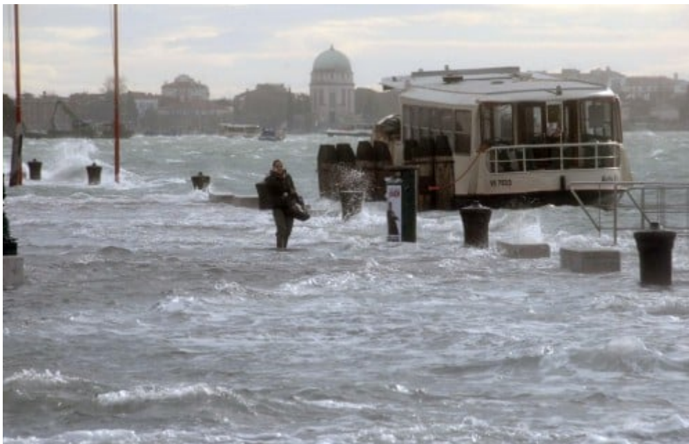
- ผู้หญิงคนหนึ่งกำลังยืนรอเรือข้ามฟากอยู่ ในขณะที่ผู้เชี่ยวชาญในเมืองเวนิซเริ่มประกาศเตือนว่ากระแสน้ำอาจสูงถึง 1.60 เมตร ซึ่งถ้าเป็นจริงนั้นจะเป็นปรากฏการณ์ Acqua Alta ที่รุนแรงที่สุดในรอบ 30 ปี