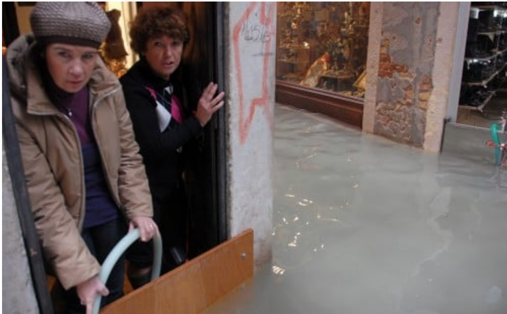
- จากภาพเจ้าของร้านค้ากำลังดูดูน้ำออกจากร้าน หลังจากที่ทำผนังกันน้ำไม่ให้ไหลเข้าทวรมานเสร็จเรียบร้อยแล้ว