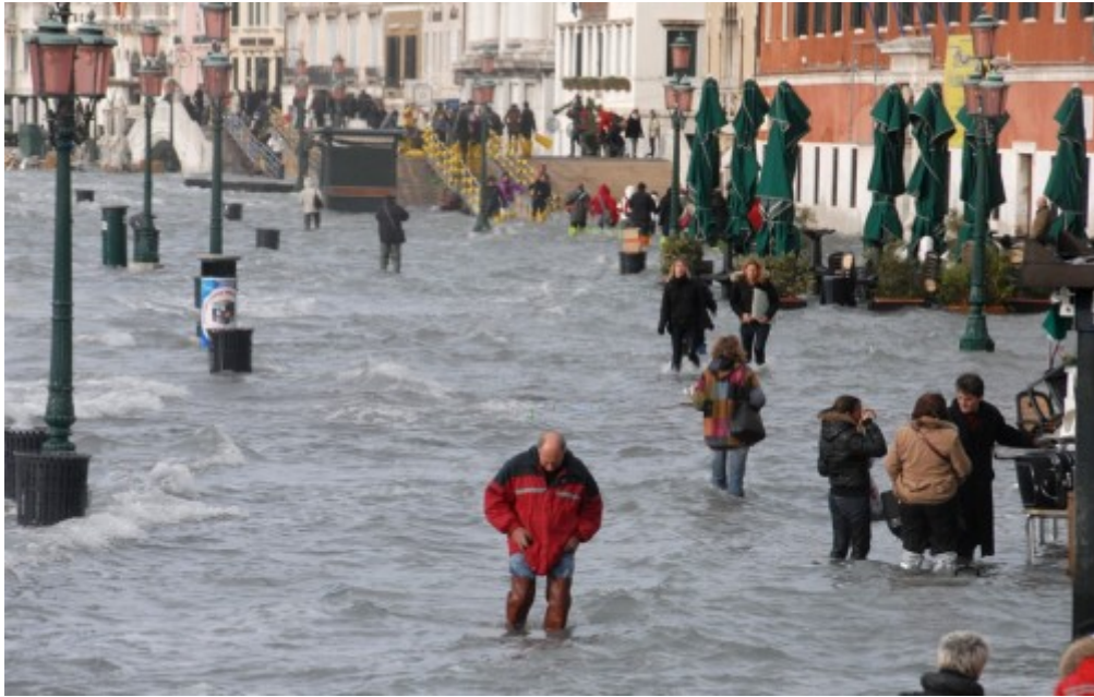
- ผู้คนกำลังเดินข้ามคลองใหญ่ในเวนิซ