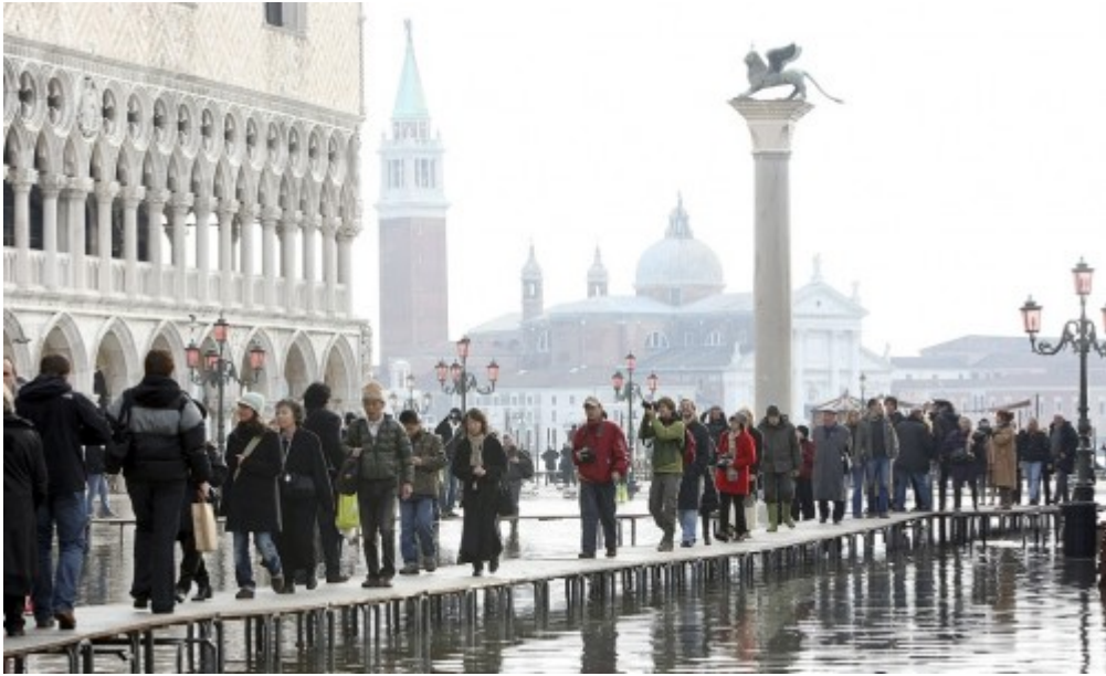
- นักท่องเที่ยวและชาวเมืองต่างพากันเดินบนทางเดินที่ถูกสร้างขึ้นชั่วคราวข้ามลาน San Marco