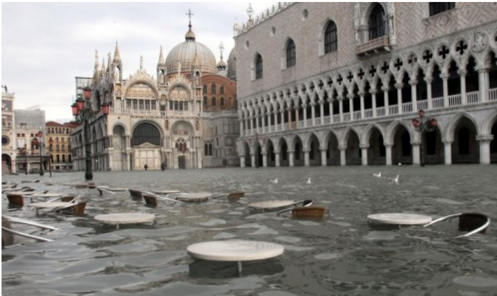
- สภาพโต๊ะนั่งชมบรรยากาศของร้านกาแฟแถวลาน San Marcoที่ตอนนี้มีแต่นกนางนวลเกาะ