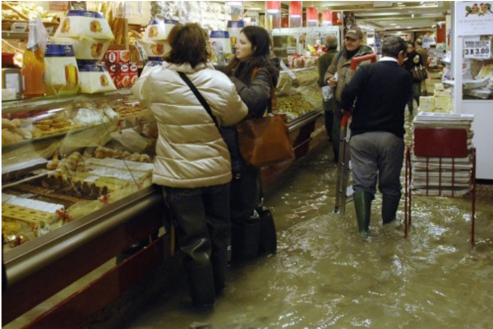
- น้ำท่วมก็ไม่หวั่น ก็ของมันต้องกินต้องใช้นี่