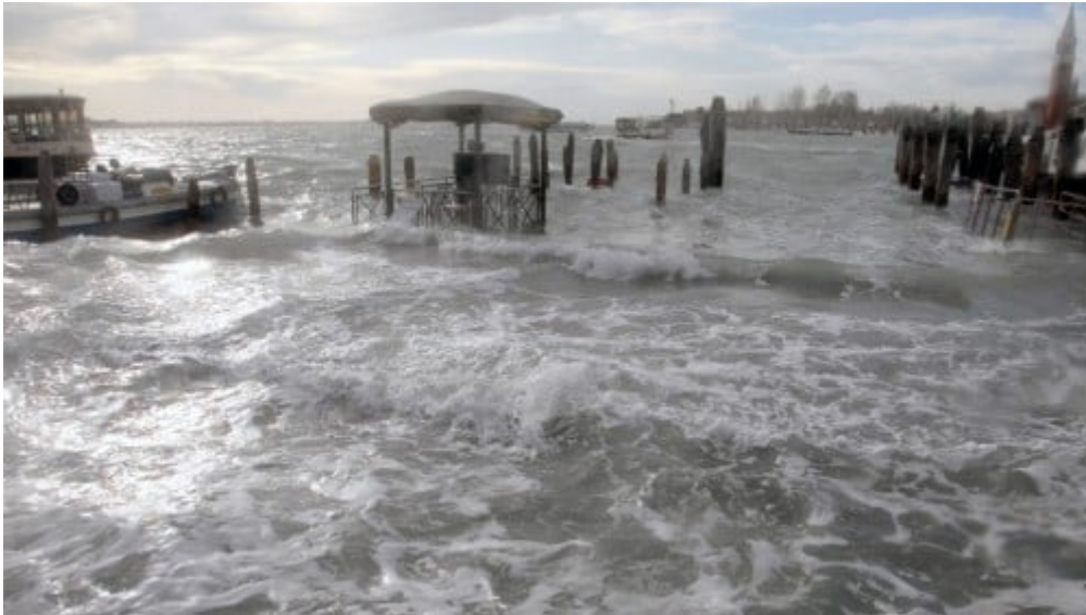
- บริเวณท่าเรือเวนิซเมื่อวันที่ 1 ธันวาคม