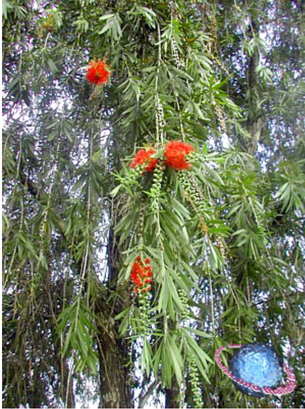
9.หลิว ใบเล็กเรียวยาวสวย พุ่มโปร่ง กิ่งอ่อน ลู่ลม ได้บรรยากาศดี