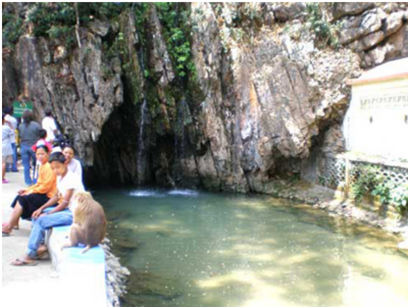
วัดถ้ำปลา

นอกจากนี้ จะพบหินงอกที่ก่อตัวขึ้นใหม่ของชาวบ้านที่เรียกว่า "นมสาว" และมีบ่อน้ำเล็ก ๆ ภายในถ้ำเป็นระยะ ๆ บริเวณจุดลึกที่สุด จะพบห้องพระรอยองค์ซึ่ง พระครูบาชุ่ม ได้บิณฑูไว้เมื่อครั้งที่ท่านเคยปฏิบัติกรรมฐานอยู่เรียงรายอยู่อย่างสวยงาม เป็นที่ประทับใจยิ่ง และด้วยความที่ถ้ำมืดและลึก จึงต้องมีผู้ชำนาญถือไฟฉายนำเข้าไป