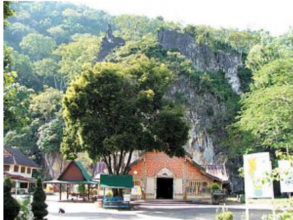
วัดถ้ำปลา