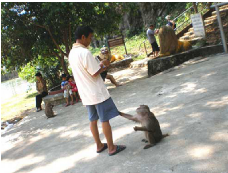
วัดถ้ำปลา

ทั้งนี้ "ถ้ำปลา" มีลักษณะเป็นโพรงหินกว้างใหญ่ลึกเข้าไปในภูเขา อยู่ระดับต่ำกว่าพื้นดิน มีน้ำใสเย็นไหลออกมาตลอดปี ในอดีตมีปลาชุกชุมตามธรรมชาติเวียนว่ายอยู่ในแอ่งบริเวณปากถ้ำ เรียกว่า "ปลาพวงหิน" หรือ "ปลาพุง" ลักษณะรูปร่างกลมยาว มีเกล็ดตามลำตัวคล้ายปลาช่อน แต่สีออกน้ำเงินเข้ม มีแถบสีน้ำเงินพาดสีข้าง ลำตัวยาวรวมคีบ และยังมีปลาสวยงามอีกหลายชนิด ซึ่งปัจจุบันได้สูญพันธุ์ไปแทบไม่เหลือให้เห็น ซึ่งปัจจุบันมีผู้นำปลาสวยงามมาปล่อยเป็นจำนวนมาก เช่น ปลาดุก ปลาคาร์พ ปลาไหล ปลาทับทิม ปลาเงินปลาทอง ปลาไน และ เต่า ฯลฯ