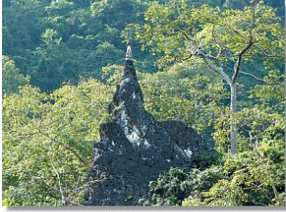
วัดถ้ำปลา