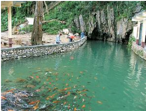
วัดถ้ำปลา