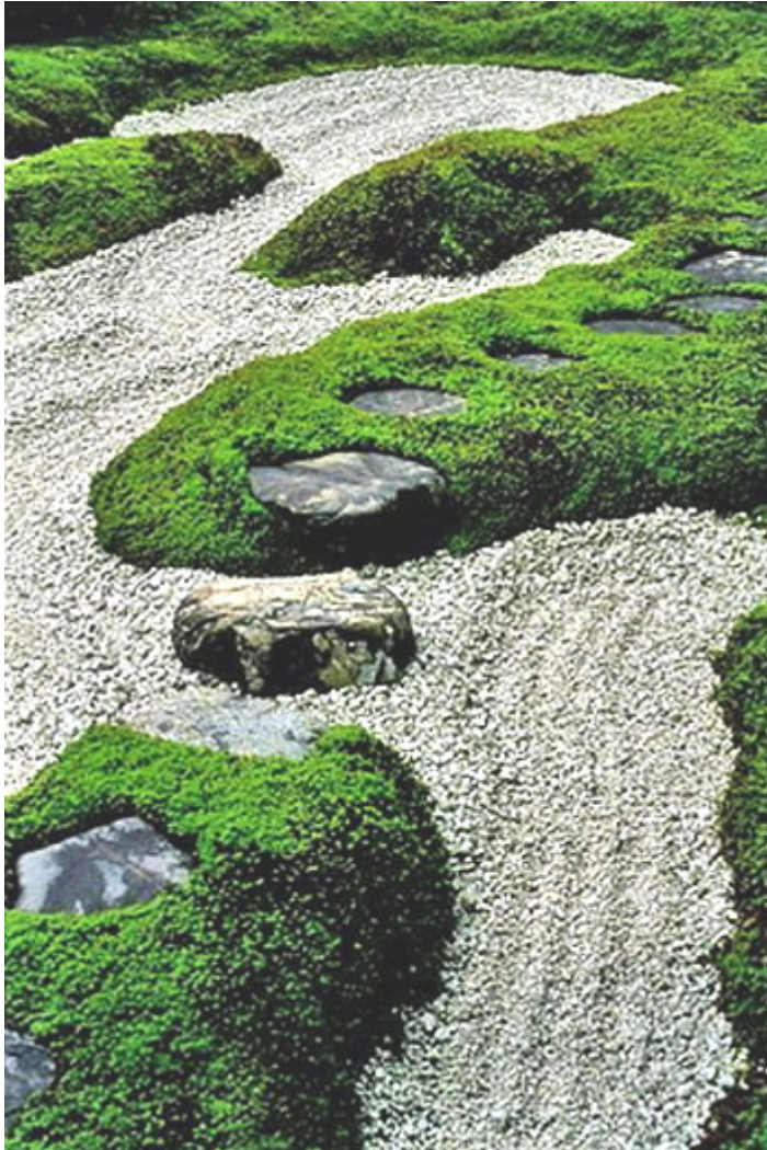
สวนในที่ราบแบบแห้ง (Dry landscape gardens)

เพื่อประโยชน์ใช้สอย สวนในที่ราบแบบนี้ นิยมจัดไว้ที่ มุมใดมุมหนึ่งใกล้ๆ เรือน้ำชาหรือบ้านพัก เพื่อใช้หน้าในอ่างล้างมือ ล้างหน้าหรือล้างเท้า ก่อนขึ้นบ้าน แต่ในปัจจุบันมิได้ใช้ประโยชน์เพียงแต่มีไว้เพื่อเป็นการประดับเท่านั้น สวนแบบนี้อาจจะไม่เหมาะกับสภาพอากาศของเมืองไทย เพราะร้อนและแสง การใช้หญ้าหรือมอสส์ก็ไม่ค่อยได้ผล เพราะต้องการความชื้นสูงและอากาศเย็น พอมาปลูกแบบของเรานั้นจึงจะไม่เขียวขม