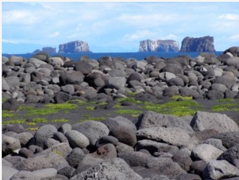
เซิร์ตซี ประเทศไอซ์แลนด์