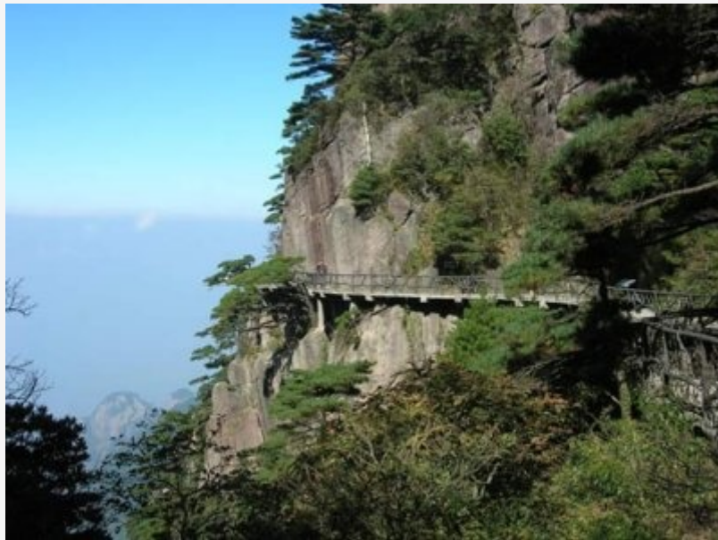
อุทยานแห่งชาติเทือกเขาฉิงซาน ประเทศจีน