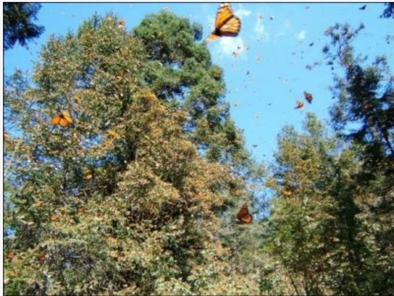
อุทยานชีวมณฑลผีเสื้อกษัตริย์ ประเทศเม็กซิโก