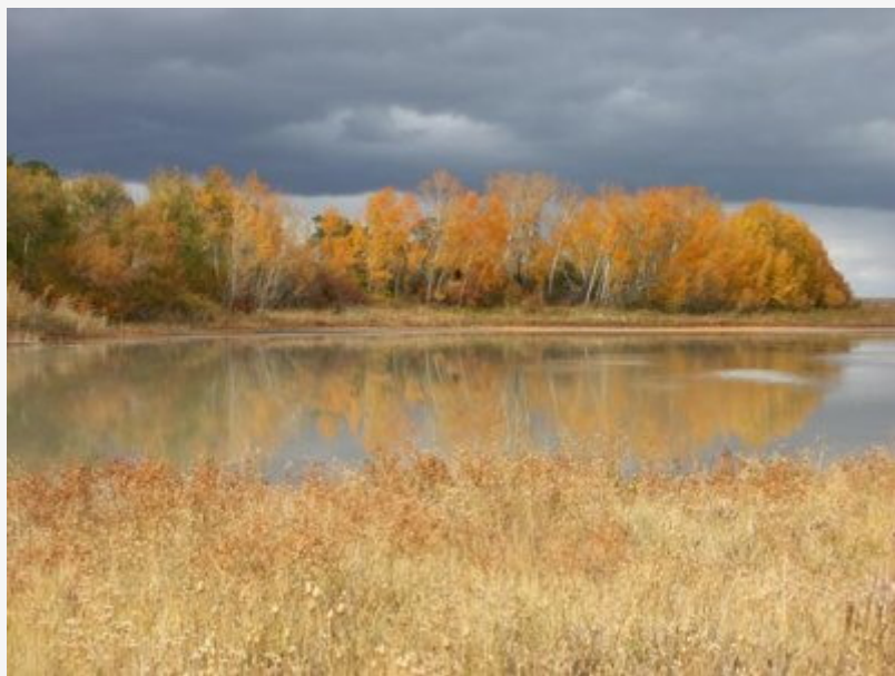
ชาร์ยากา ที่ราบและทะเลสาบคาคซ์สถานทางเหนือ