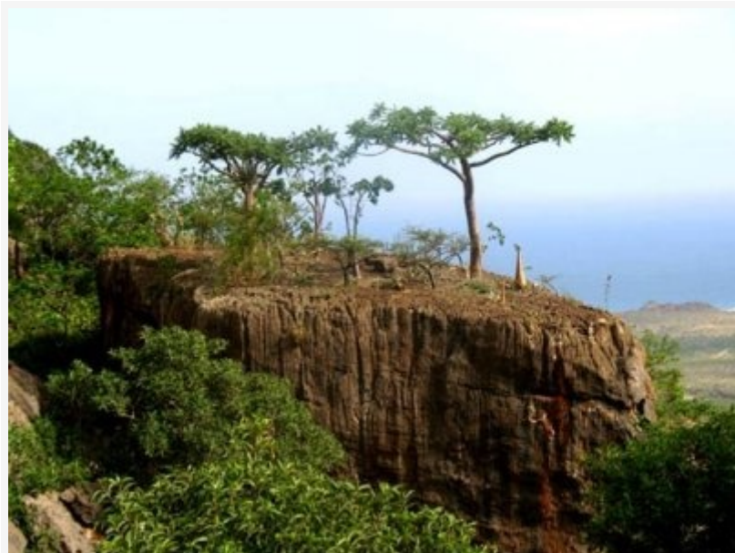
หมูเกาะโซโคตรา ประเทศเยเมน