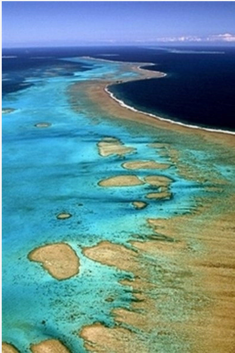
ทะเลสาบนิวคาสีโดเนีย ประเทศฝรั่งเศส