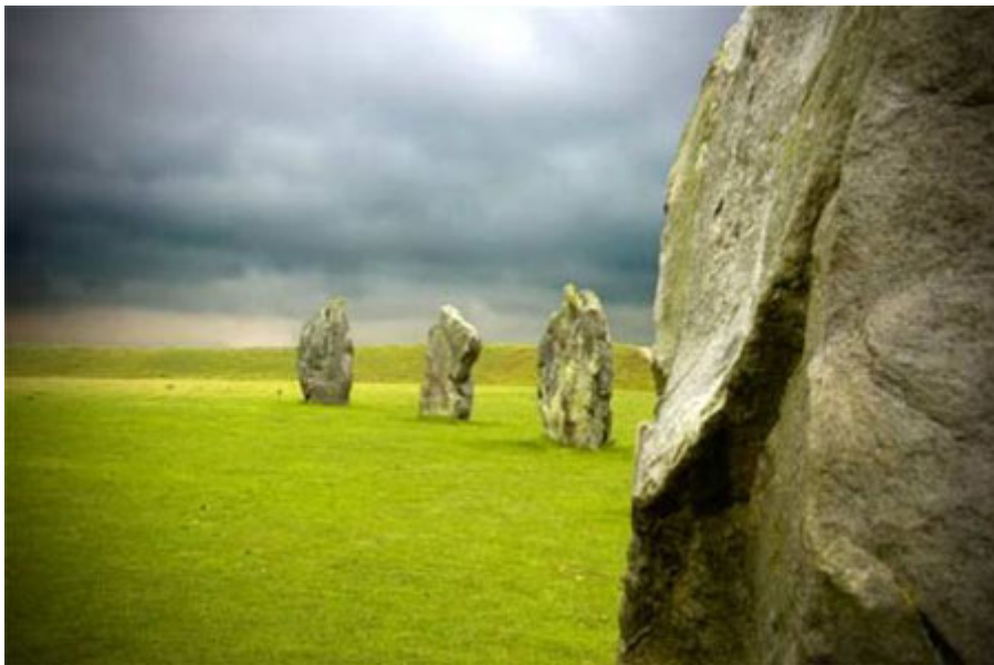
อะเวอบิวรี ประเทศอังกฤษ

ซึ่งความ จริงแล้วยังมีสถานที่บางแห่ง ที่นักท่องเที่ยวอาจนึกไม่ถึง แต่ก็งดงามไม่แพ้สิ่งมหัศจรรย์เหล่านั้น ในหนังสือชื่อ The Road Less Travelled ของ บิล ไบรสัน เขาเขียนถึงสถานที่ท่องเที่ยวที่ถูกจัดอันดับไว้เกินจริง พร้อมกับแนะนำสถานที่ที่ทางเลือกไว้ดังนี้