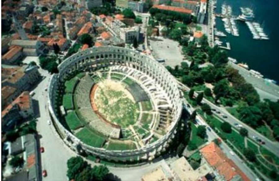
โคลอสเซียมแห่งปูลา ประเทศโครเอเชีย