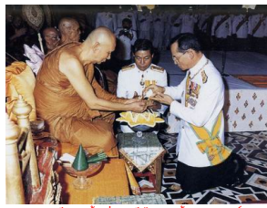
พระบาทสมเด็จพระเจ้าอยู่หัวเสด็จไปถวายน้ำพระมหาสังข์กับสมเด็จพระสังฆราช ในวันขึ้นปีใหม่กลาง สยามให้สมเด็จพระญาณสังวร เป็นสมเด็จพระสังฆราช

ได้เกิดวัฒนธรรมอำนาจใหม่ขึ้นมาเป็น อนเนกชนนิกรสโมสรรสมมติ มาถึงปัจจุบัน