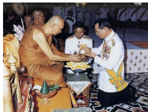
พระบาทสมเด็จพระเจ้าอยู่หัวเสด็จไปถวายน้ำพระมหาสังข์กับสมเด็จพระสังฆราช ในวันขึ้นปีใหม่หลวง ตามประเพณีของชาวสุพรรณ เป็นสมเด็จพระสังฆราช

ได้เกิดวัฒนธรรมอำนาจใหม่ขึ้นมาเป็น อนเนกชนนักรสโมสรรสมมติ มาถึงปัจจุบัน