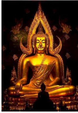
[พระพุทธอินทร์ วัดพระศรีรัตนมหาธาตุวรมหาวิหาร จ.พิษณุโลก]