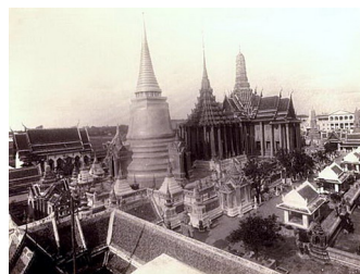
[วัดพระศรีรัตนศาสดาราม (วัดพระแก้ว) ภายในพระบรมมหาราชวัง บริเวณปราสาทพระเทพบิดร พระมณฑปซึ่งเป็นประดิษฐานพระไตรปิฎก และพระศรีรัตนเจดีย์ ซึ่งบรรจุพระบรมสารีริกธาตุ พ.ศ.๒๓๕๓ : ภาพลายสมัยรัชกาลที่ ๔]

วัฒนธรรมการใช้อำนาจของพระมหากษัตริย์ จึงค่อนข้างจะสมบูรณาญาสิทธิราช แต่ก็มี พระธรรมศาสตร์ พระราชศาสตร์ คอยเป็นเครื่องกำกับป้องกันการข่มเหงประชาชน