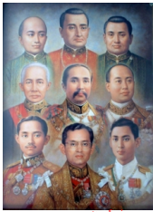
[พระมหากษัตริย์แห่งบรมราชจักรีวงศ์]