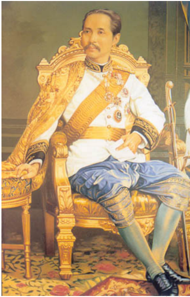
[พระบาทสมเด็จพระจุลจอมเกล้าเจ้าอยู่หัว รัชกาลที่ ๕ : พระปิยะมหาราชแห่งราชจักรีวงศ์]

นอกจากนี้ พระมหากษัตริย์ในสมัยโบราณ ยังต้องปฏิบัติตนให้อยู่ในราชธรรม ๓๘ ประการ เช่น ต้องดูแลรักษาประชาชนดุจครูรักษาศิษย์ หรือมารดารักษาลูกของตน ฯลฯ