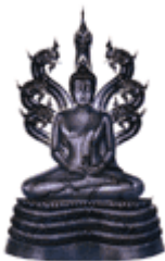
❖ พระประจำวันเสาร์