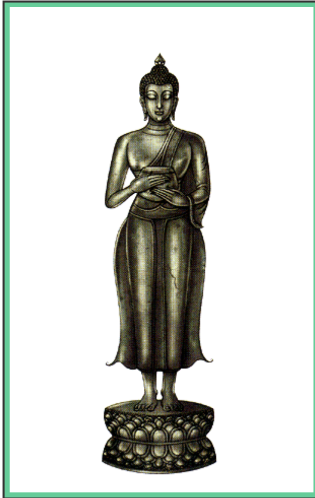
"ปางอุ้มบาตร"

พระพุทธรูปอยู่ในพระอริยาบถยืน พระหัตถ์ทั้งสองประคองบาตรราวสะเอว