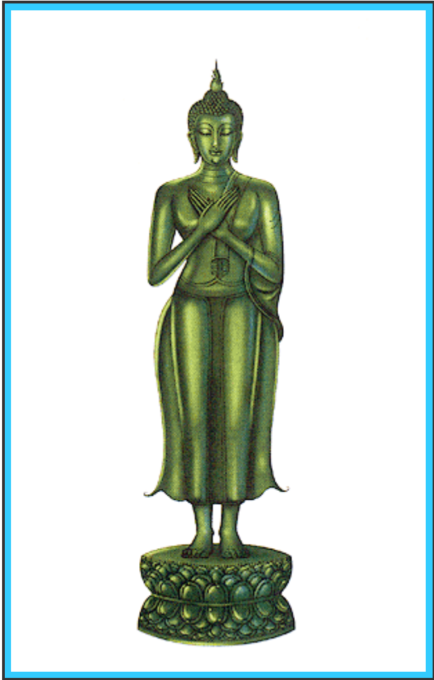
"ปางรำพึง"

พระพุทธรูปอยู่ในพระอริยาบถยืน พระหัตถ์ทั้งสองประสานกันยกขึ้นประทับที่พระอุระ (อก) พระหัตถ์ขวาทับพระหัตถ์ซ้าย