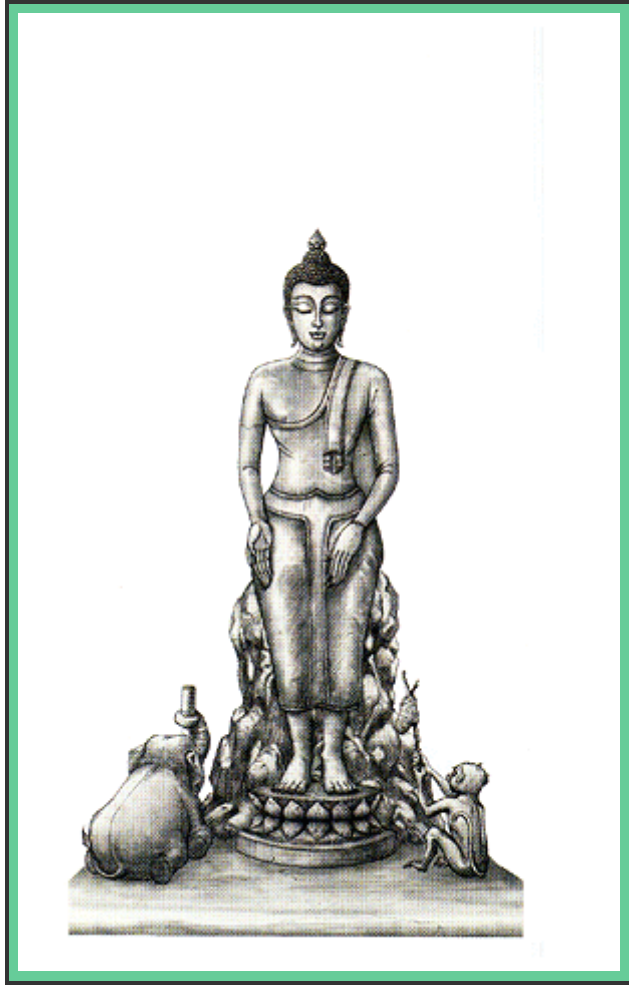
"ปางปาลิไลยก์ (พระประจำวันพุทธกลางคืน)"

พระพุทธรูปอยู่ในพระอริยาบถประทับ (นั่ง) บนก้อนศิลา พระบาททั้งสองวางบนดอกบัว พระหัตถ์ซ้ายวางคว่ำบนพระขนุ (เข่า) พระหัตถ์ขวาวางหงาย นุ้ยมสร่างขางหมอบไขว่ขวางจับกระบองนำ อีกด้านหนึ่งมีลิงถือรวงผึ้งถวาย