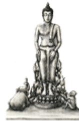
❖ พระประจำวันพุธ