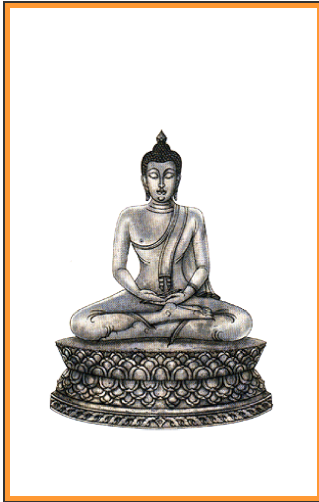
"ปางสมาธิหรือปางตรัสรู้"

พระพุทธรูปอยู่ในพระอริยมถประทับ (นั่ง) ขัดสมาธิ พระหัตถ์ทั้งสองวางหงายซ้อนกันบนพระเพลา (ตัก) พระหัตถ์ขวาทับพระหัตถ์ซ้าย พระชงฆ์ (แขน) ขวาทับพระชงฆ์ซ้าย