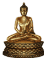
❖ พระประจำวันพระเกตุเสวยอายุ