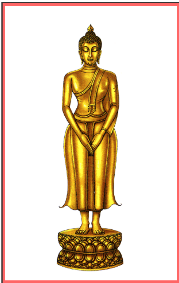
"ปางถวายเนตร"

พระพุทธรูปอยู่ในพระอริยาบถยืน ลืมพระเนตรทั้งสองเพ่งไปข้างหน้า พระหัตถ์ทั้งสองห้อยลงมาประสานกันอยู่ระหว่างพระเพลา (ตัก) พระหัตถ์ขวาซ่อนเหลี่ยมพระหัตถ์ซ้าย อยู่ในพระอาการสังวรทอดพระเนตรดูตนพระศรีมหาโพธิ์