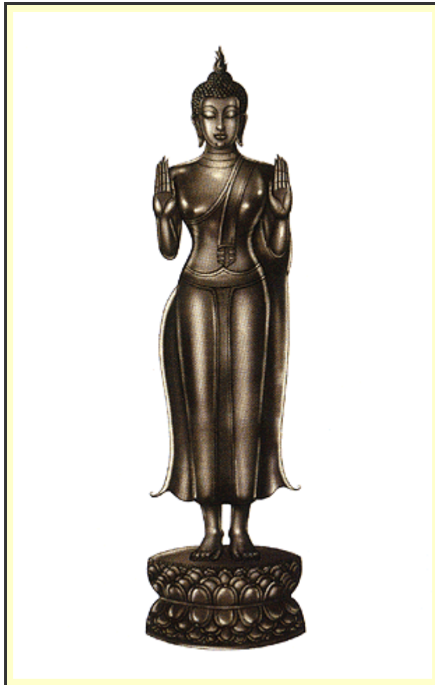
"ปางห้ามสมุทร"