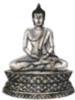
❖ พระประจำวันพฤหัสบดี