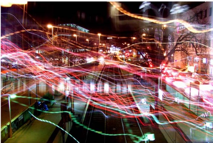
"สับสน" ดัดแปลงโดย aseptic

"Linderpark" in Reibstock Germany