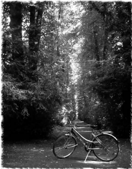
After long way

"Linderpark" in Reibstock Germany