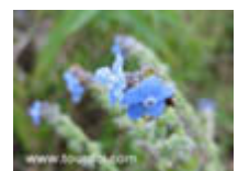
ฟอร์เก็ตมีน้อท