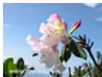
กุหลาบขาวเชียงดาว