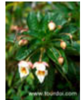
เทียนผานางคารร์