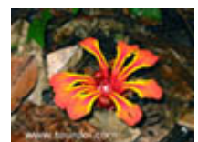
ปลูดใหญ่