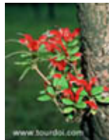
ว่านไก่แดง