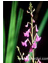
ว่านพร้าว