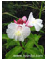
เอื้องหมายนา