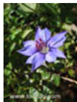
หรีดเชียงดาว