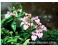
ลิ้นมังกร