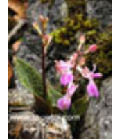
เอื้องศรีเชียงดาว