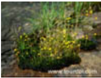
สร้อยสุวรรณภา