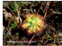
หยาดน้ำค้าง