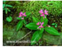
เทียนน้อย