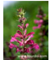
ชมพู่เชียงดาว