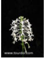
นางอ้วนน้อย