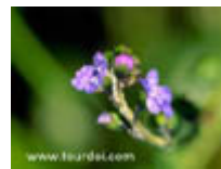
หญ้ามนฟ้า