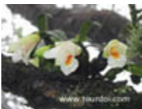
เอื้องตะกั่ว