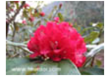
กุหลาบพันปี