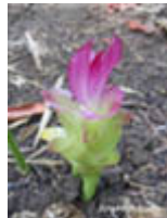
กระเจียว