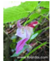
เทียนนกแก้ว