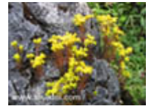
ฟองหินเหลือง