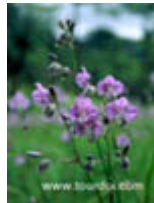
ดอกหงอนนาค