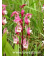
เอื้องปากนกแก้ว