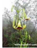
ลิลลีดอย