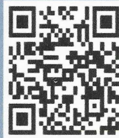
ดาวน์โหลดใบสมัคร

ดาวน์โหลดใบสมัคร หรือ สมัครผ่าน google from