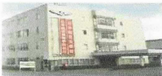
Noto Airport Campus