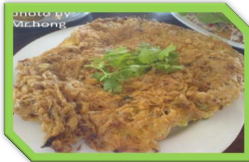
Fried Red Ant Eggs.