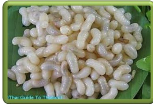
Red Ant Eggs Roast