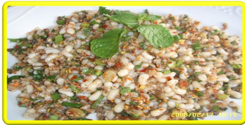
Yam Kai Mot Daeng