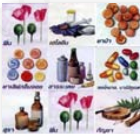
รูปที่ 1 สารเสพติด

สารเสพติด หมายถึง สารเคมีหรือวัตถุที่เมื่อเสพเข้าสู่ร่างกายไม่ว่าวิธีใดก็ตามจะทำให้ต้องการเสพและต้องการเพิ่มปริมาณขึ้นเรื่อย ๆ ส่งผลให้เกิดโทษต่อร่างกายและจิตใจ