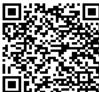
หลักสูตรอบรมออนไลน์ โรงเรียนคุณธรรม สพฐ.