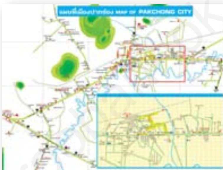
ภาพแผนที่เมืองปากช่อง

ทิศตะวันตกติดกับอำเภอมวกเหล็กจังหวัดสระบุรี