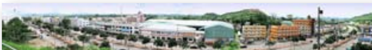
ภาพปากช่องมุมกว้าง

ความสำคัญของอำเภอปากช่องคือ เป็นอำเภอที่มีความสำคัญอำเภอหนึ่งของจังหวัดนครราชสีมา เพราะเป็นอำเภอที่เป็นช่องทางที่ชาวอีสานจะเดินทางติดต่อกับภาคกลางสู่กรุงเทพมหานคร โดยผ่าน อำเภอ มวกเหล็ก จังหวัดสระบุรี และในทางเดียวกันคนภาคกลางก็จะติดต่อกับชาวอีสาน ๑๕ จังหวัดโดยผ่านอำเภอปากช่องสู่จังหวัดนครราชสีมา และจังหวัดอื่นๆของภาคอีสานเช่นเดียวกัน นับว่าอำเภอปากช่องเป็นประตูด่านแรกของอีสาน ซึ่งเป็นเมืองที่มีความสำคัญมาแต่โบราณ ในอดีตช่องทางนี้จะต้องฝ่าอันตรายนานาประการ เพราะพื้นที่เป็นภูเขาสูงมีป่าดงดิบ คือดงพญาเย็นและดงพญาไฟ มีไข้ป่า มีสัตว์ร้ายชุกชุม คนที่จะเดินทางผ่านเส้นทางนี้จะต้องใช้เวลาเดินทางนานเป็นแรมเดือน จึงจะผ่านออกไปได้ ปัจจุบันอำเภอปากช่องมีความสำคัญ ทั้งทางเศรษฐกิจ การศึกษา สังคม และวัฒนธรรม เป็นเมืองที่มีภูมิทัศน์ที่สวยงาม มีถ้ำ มีเขาใหญ่ที่เป็นอุทยานแห่งชาติและเป็นมรดกโลก มีน้ำตก มีผลไม้โดยเฉพาะน้อยหน่า และข้าวโพดขายตลอดปี มีที่พัก โรงแรม สนามกอล์ฟ และร้านอาหารอร่อย ฯลฯอากาศก็ดี ผู้คนมีอัธยาศัยไมตรีเป็นมิตรกับผู้มาเยือน