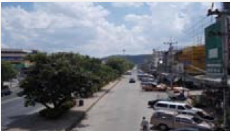
ภาพอำเภอปากช่องในปัจจุบัน พ.ศ.2555

ตำบลวังไทร และเทศบาลตำบลหมูสี องค์การบริหารส่วนตำบล ๕ แห่งดังนี้ องค์การบริหารส่วนตำบลปากช่อง องค์การบริหารส่วนตำบลหนองสาหร่าย องค์การบริหารส่วนตำบลวังกะทะ องค์การบริหารส่วนตำบลคลองม่วง องค์การบริหารส่วนตำบลจันทึก องค์การบริหารส่วนตำบลชนงพระ องค์การบริหารส่วนตำบลโป่งตาลอง องค์การบริหารส่วนตำบลพญาเย็น องค์การบริหารส่วนตำบลหนองน้ำแดง