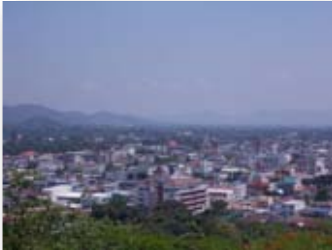
ภาพเมืองปากช่องในปัจจุบัน

ได้แก่ เขาแหลม มีความสูงถึง ๑๓๒๖ เมตร ซึ่งเป็นยอดเขาที่สูงที่สุดของจังหวัดนครราชสีมา เขากำแพง เขาอีพร้อม เขาช้างหลูด เขาวง และเขาละมั่ง เทือกเขานี้เป็นต้นกำเนิดของแม่น้ำมูลและ ลำพระเพลิง เขตที่ราบเชิงเขาเหล่านี้เป็นเขตที่ราบลูกคลื่นลอนลาดและลูกคลื่นลอนชัน มีความสูงอยู่ในช่วง ๒๕๐-๕๐๐ เมตร เป็นพื้นที่ที่มีดินเหมาะแก่การปลูกพืชไร่ เช่นที่ตำบลกลางดง มีการปลูกมะม่วง มะละกอ น้อยหน่า ขนุนและข้าวโพดหวาน ข้าวโพดเลี้ยงสัตว์ ตลอดจนผลไม้อื่นๆอีกมาก นอกจากนี้ยังมีการเลี้ยงสัตว์ การทำฟาร์มโคนเนื้อและโคนนม เช่น ที่ฟาร์มโชคชัย ซึ่งเป็นแหล่งผลิตโคนเนื้อ โคนมที่ใหญ่ที่สุดในภาคตะวันออกเฉียงเหนือ ปัจจุบันยังทำให้เป็นแหล่งท่องเที่ยวอีกด้วย เนื่องจากเป็นภูมิประเทศที่สวยงาม บางเขตจึงทำสวนเกษตร เช่น ปลูกไร่องุ่น สวนแก้วมังกร สวนปาล์ม ทำรีสอร์ท สนามกอล์ฟ ฯลฯ