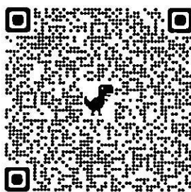
QR Code สมัคร